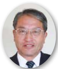
中村 勝明 議員

国が情報を一元管理するマイナンバーが施行され、10月から通知カードの郵送が始まり、全国で配達間違いなどが生じている。これでは、本格運用に突き進むのは余りに危険ではないか。大量の個人情報と結びつけることが可能なマイナンバーには、情報の洩れ、国による国民監視の強化などに国民