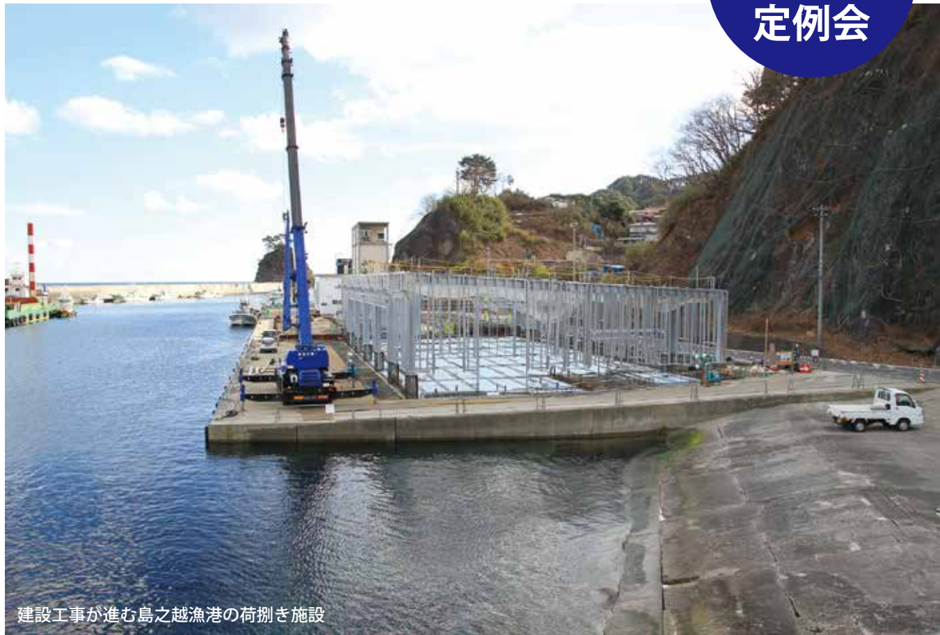
建設工事が進む島之越漁港の荷捌き施設