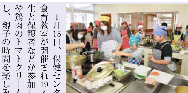
食生活改善推進員さんの指導を受け、仲良くおいしい料理を作りました

役場☎34-2111 / 教育委員会☎34-2226 / 医科診療所☎33-3101 / 歯科診療所☎33-3100 / 保健福祉課☎33-3102