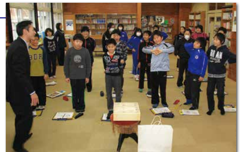
1億円の模擬札束を前にしても冷静な6年生の皆さん

最後に、村が用意した1億円の模擬札束を持ってみる体験をし、「思ったより軽い」などと盛り上がりました。