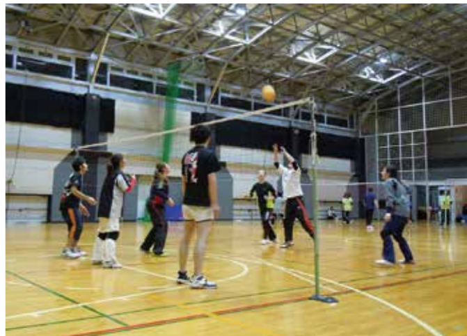
ソフトバレー教室は毎週月曜日に開催（資料写真）

スポーツのほか、文化、ボランティア、地域活動などを行う4人以上の団体が対象。移動の往復途中も含めた活動中の損害事故、賠償責任を負う事故を補償します。保険期間は4月1日から平成29年3月31日までの1年間。中途加入でも年間掛け金が適用されるので年度当初の加入をおすすめします。もしもに備えて加入を検討してみたいかがでしょうか。