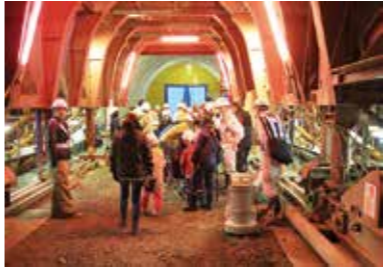
トンネル内部はまだ工事中

製。6月の工事完成時には、切牛、島の沢両坑口に設置されることとなります。 トンネルは仕上作業 見学会では、昨年8月4日にトンネルが貫通した様子が映像で紹介されました。トンネルが貫通し、光が差し込むと、参加者から自然と拍手が起こり、貫通した時の工事関係者の喜びと苦勞が伝わってきました。またトンネルの測量・施工方法の紹介やコンクリート配筋作業体験を実施し、トンネル工事の難しさを学びました。 全長189メートルの島の沢トンネルの工事は、一部壁面へのコンクリート打設とコンクリート舗装工事が残っていますが、ほぼ仕上げの段階に入っているとのこと。トンネル完成は6月、切牛ー鳥越間の開通は平成29年度を目指し、工事は大詰めを迎えます。