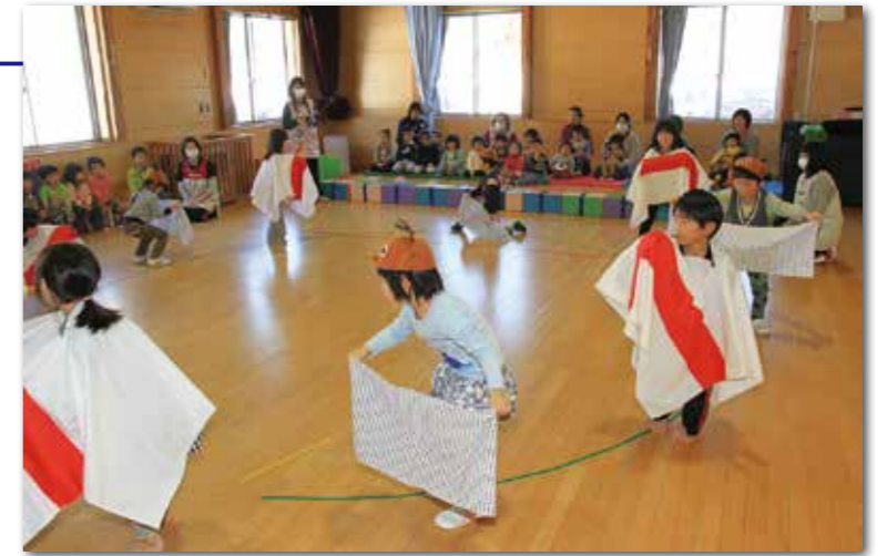
引き継ぎ会の最後に年長児と年中児と一緒に鹿踊りを披露しました

若桐保育園の鹿踊りは、6年前から菅窪鹿踊り保存会に教わり取り組んでいるもので、お遊戯会などで披露されています。