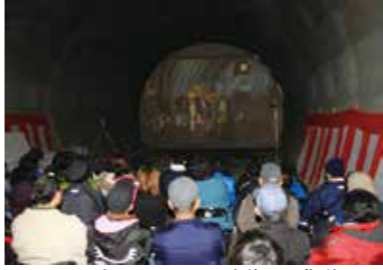
トンネル貫通の映像に感動