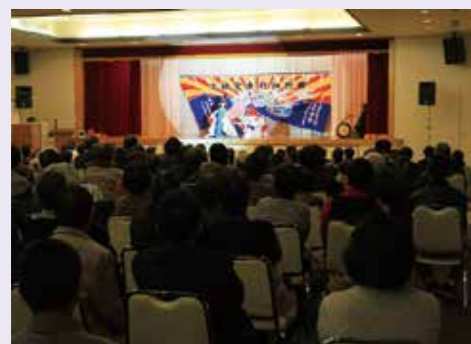
会場には約250人の観客が訪れ、大宮神楽の演目などで大いに盛り上がりました

2月21日、ホテル羅賀荘で大宮神楽保存会がアサヒグループコミュニティ1助成を活用した春の舞を主催。大宮神楽や子供神楽、新舞踊野々宮流の踊りが披露されました