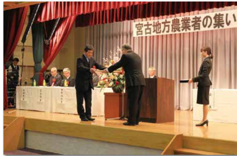
農業振興部門むらづくりの部を受賞した明戸地域資源保全委員会