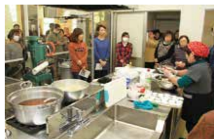
【上】どんこなますの料理説明に聞き入る参加者