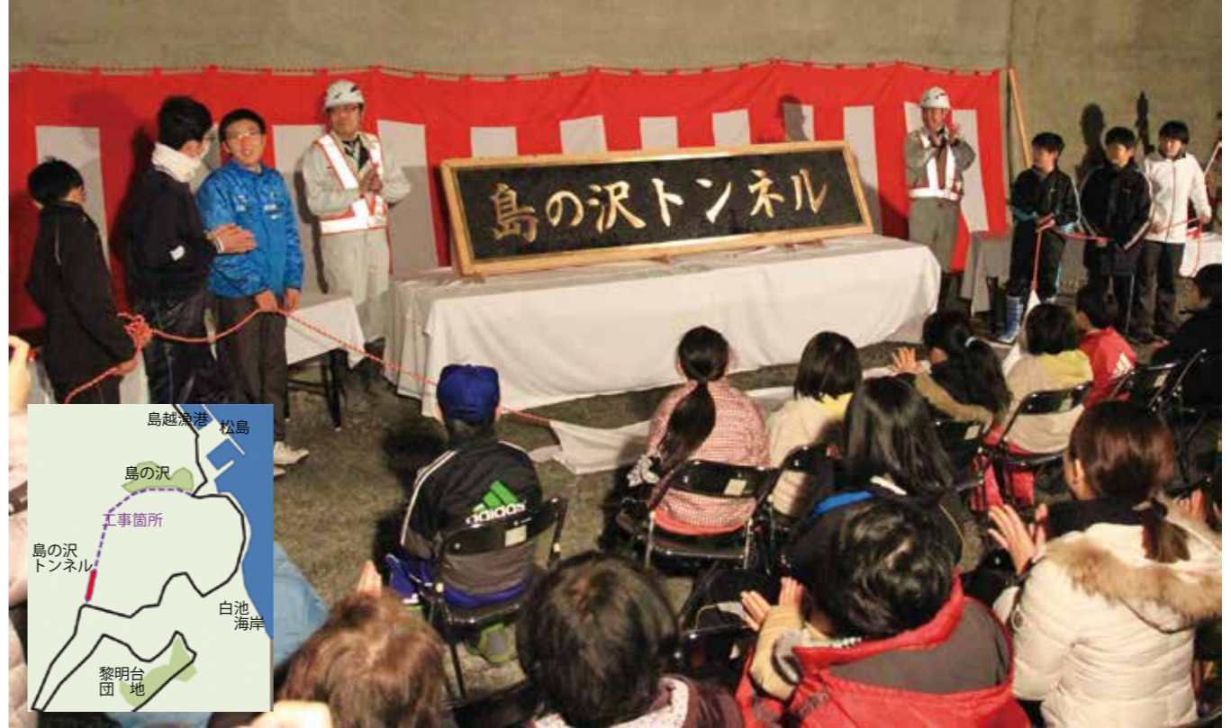
島の沢トンネルの銘板が披露されると大きな拍手が起こりました

名称決定に住民拍手 鳥越の白池海岸付近の津波浸水区域を回避するため、一昨年10月から工事が進められている主要地方道岩泉平井賀普代線の切牛と鳥越をつなぐトンネルの名称が「島の沢トンネル」に決定し、2月14日に開催された工事現場見学会で発表されました。 工事現場見学会は、工事が進む島の沢トンネル内に住民約60人が参加して行われました。はじめに、切牛、鳥越両地区の住民からの公募により選定が進められていたトンネルの名称発表会が行われ、トンネル坑口に設置される銘板の除幕で披露されました。鳥越地区の小中学生が紅白の紐を引き「島の沢トンネル」の銘板が現れると集まった住民、関係者から大きな拍手が起こりました。 銘板は重さ180kgの真ちゅう