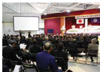
昨年の追悼式の様子