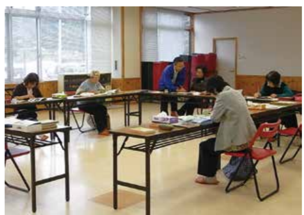
野花の写生に取り組む絵画サークルの皆さん