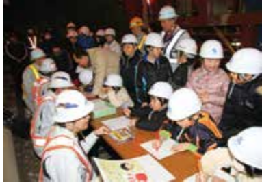
小中学生は記念の手形製作