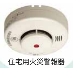
住宅用火災警報器