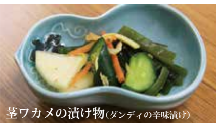
茎ワカメの漬け物(ダンディの辛味漬け)

材料…(10人分) どんこ 2尾、大根 1.5本、しょうゆ(大5)、酒(大1)、酢(好みで)