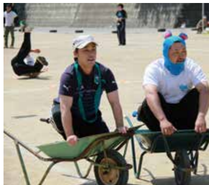
PTAレースでは転倒者が!