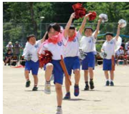
1・2年生はかわいい踊りを披露