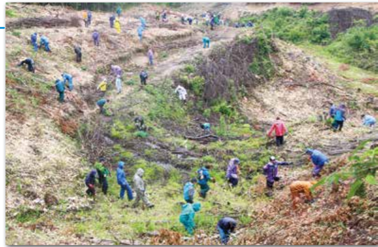
雨の中たくさんの人が参加し植樹

6月13日、林野庁東北森林管理局三陸北部森林管理署では、8月11日が「山の日」として祝日になることを記念して、広葉樹の植樹を行いました。植樹には、田野畑村漁業協同組合などから約70人が参加。「森は海の恋人」と言われ、森と海は密接な関係があることから、明戸川の源流にあたる板橋地区の国道45号沿いの山林に、ユリの木・ヤマハンの木・イチョウの木など450本の植樹を行いました。参加者は、木の健やかな成長と漁業の大漁を願いました。