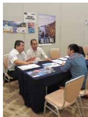
就業者フェアでの説明の様子