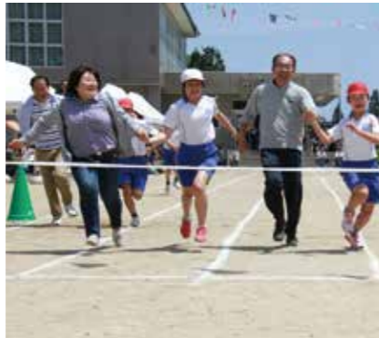
昨年度までお世話になった先生とゴールを目指す