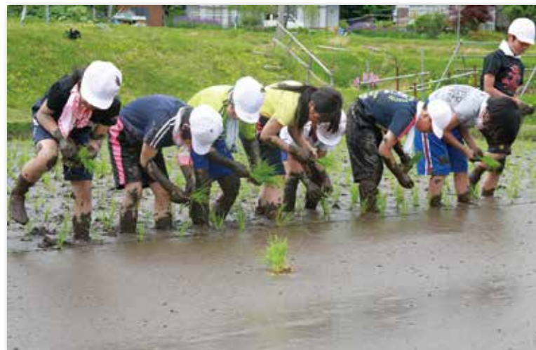
泥だらけになりながら苗を植える小学生