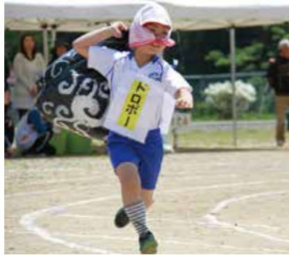
ドロボーの格好で走る児童に会場から大きな声援