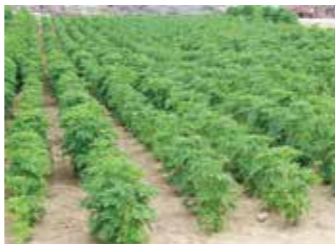
北山地区で栽培されているヤクモソウ