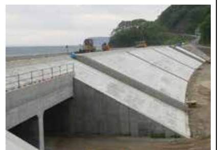
明戸防潮堤の様子