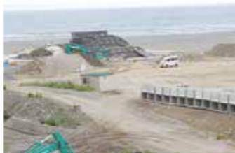
整備が進む震災遺構保存事業