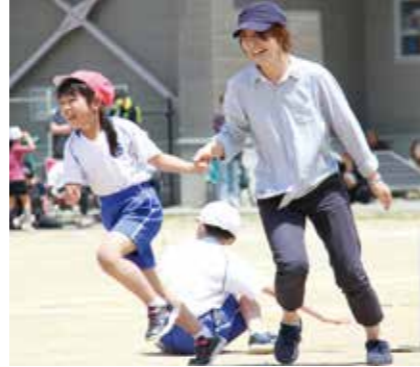
お母さんと手をつなぎ笑顔があふれる