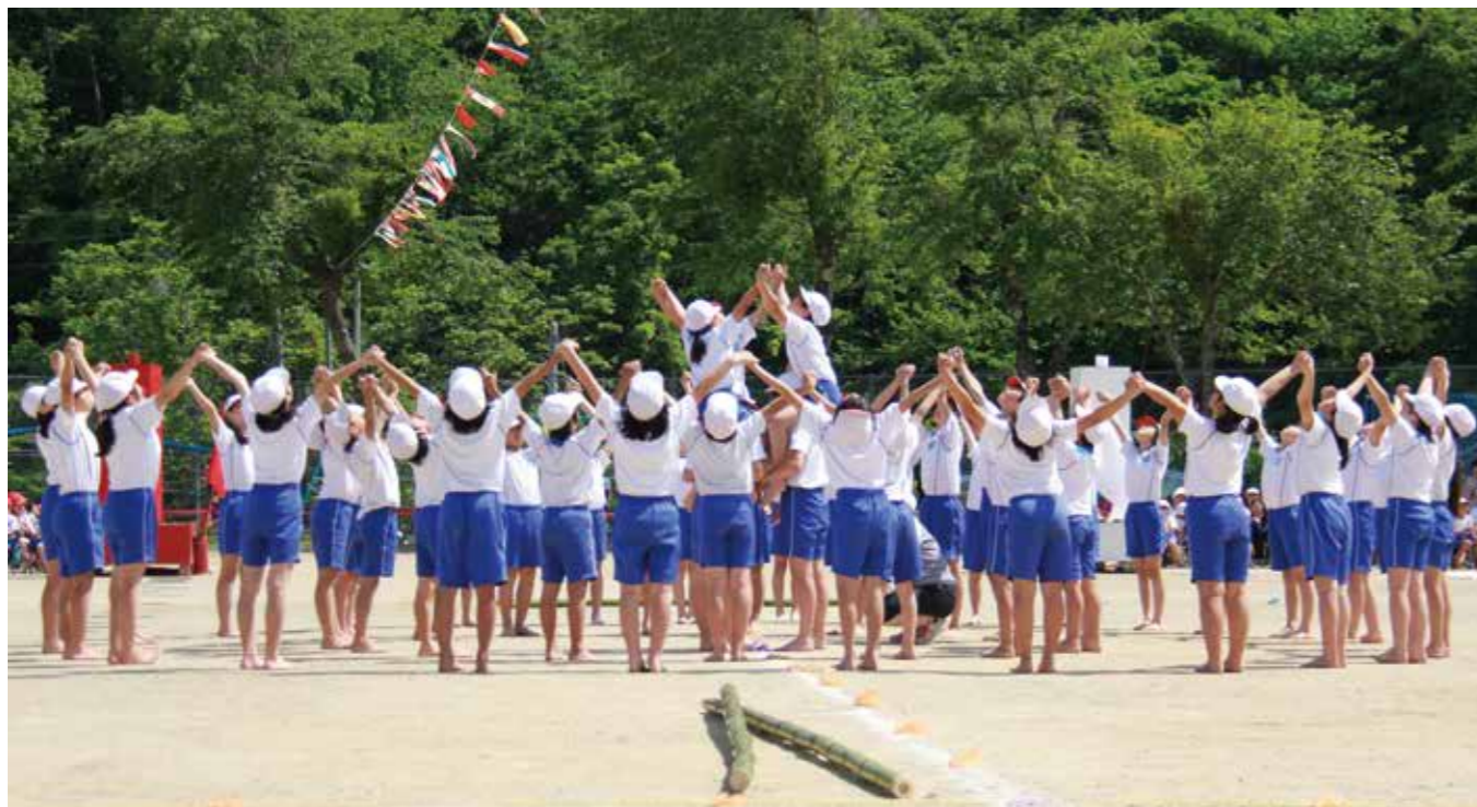
5・6年生の息のあった表現に会場から大きな拍手が送られた