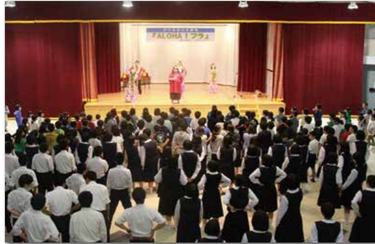
全員でフラダンスを体験