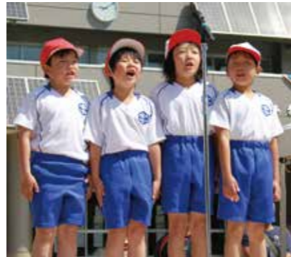
元気いっぱい開会のあいさつ