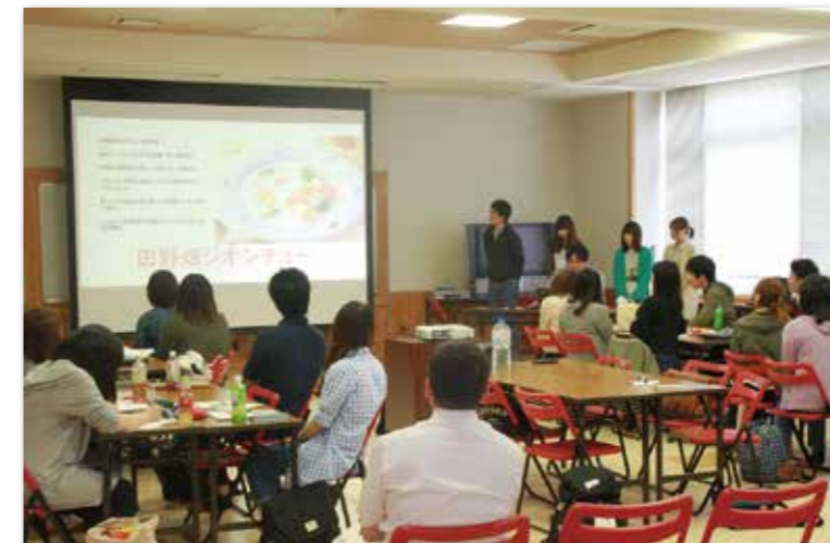
アズビィ楽習センターで行われた成果発表

岩手県立大学政策地域学部の学生25人は6月10日、11日の両日、政策課題実習を行いました。学生たちは、「田野畑村の交流人口増加策について」というテーマのもと10日は山地酪農の見学やサップ船アドベンチャーを体験。村役場の若手職員との意見交換会も行われました。