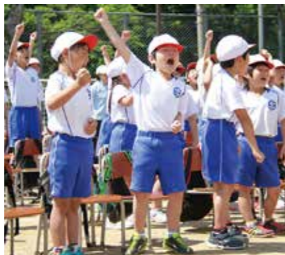
力いっぱい大きな声で応援