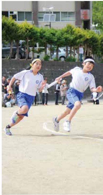
接戦のリレーでは真剣な表情