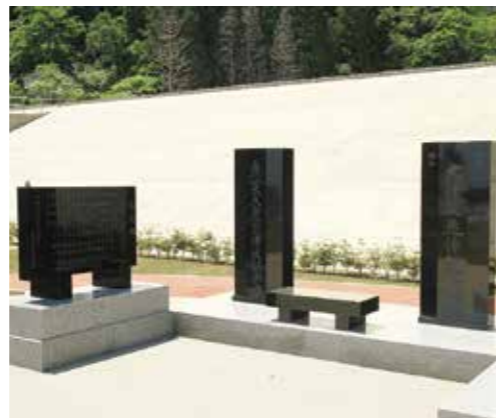
津波記念碑と慰霊碑