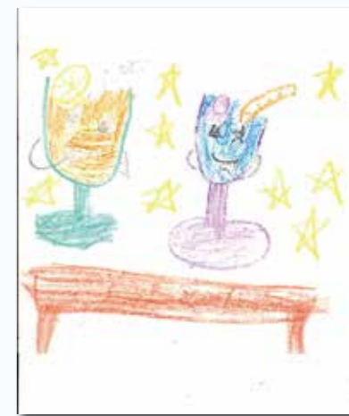
おいしいなジュースだね(広報)