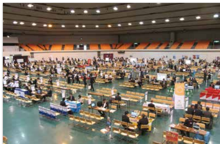
面接会会場の様子