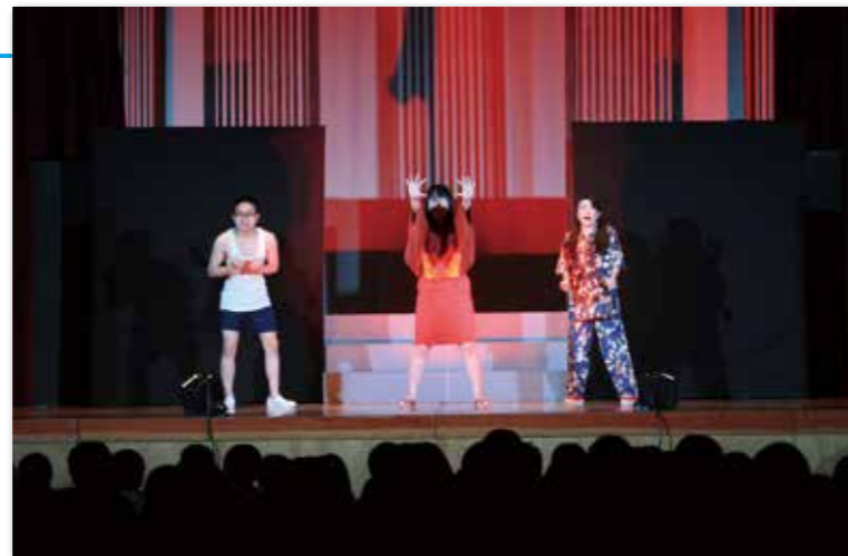
迫力のある舞台に児童から歓声が上がった

岩手県青少年劇場（日本青少年文化センターなど主催）は6月15日、アズビィホールで開催され、村内小中学生約220人が演劇を鑑賞しました。上演されたのは、演技集団「郎」による演劇「約束～大切なもの～」。舞台を通して「ずっと友達いるために、うそをついたり、だましたりしてはいけない。約束を守り、信じ続ける事が大切」と伝えました。青少年劇場は、子どもたちが心豊かに成長することを願って開催されているものです。