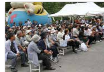
会場には多くの人々が詰めかけた