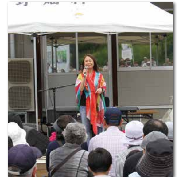
八神純子さんが歌で観客を魅了