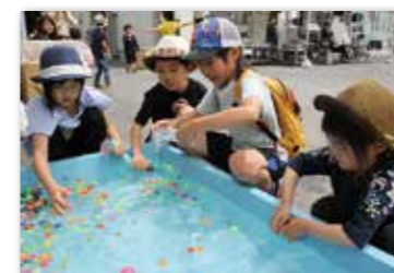
スーパーボールすくい笑顔