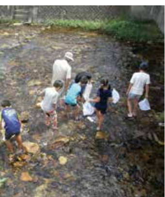
昨年の水質調査の様子

川底の砂の中や大きな石の裏に隠れている生き物から、川がきれいかどうか知ることが出来ます。みんなの暮らす田野畑村の川がきれいかみんなで調べてみよう!