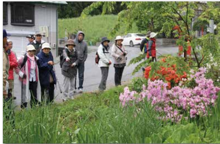
道の脇に咲く花を観賞する参加者の皆さん