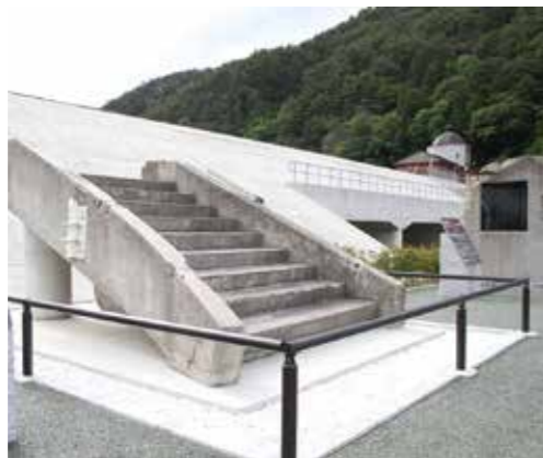
震災当時のまま残る階段の一部