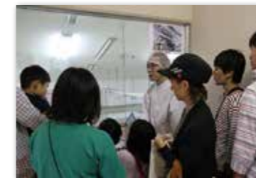
工場の内部に興味津々