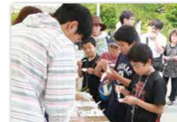
たのはたヨーグルトはどれかな?