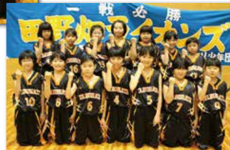
見事県大会出場を決めた田野畑ライオンズ