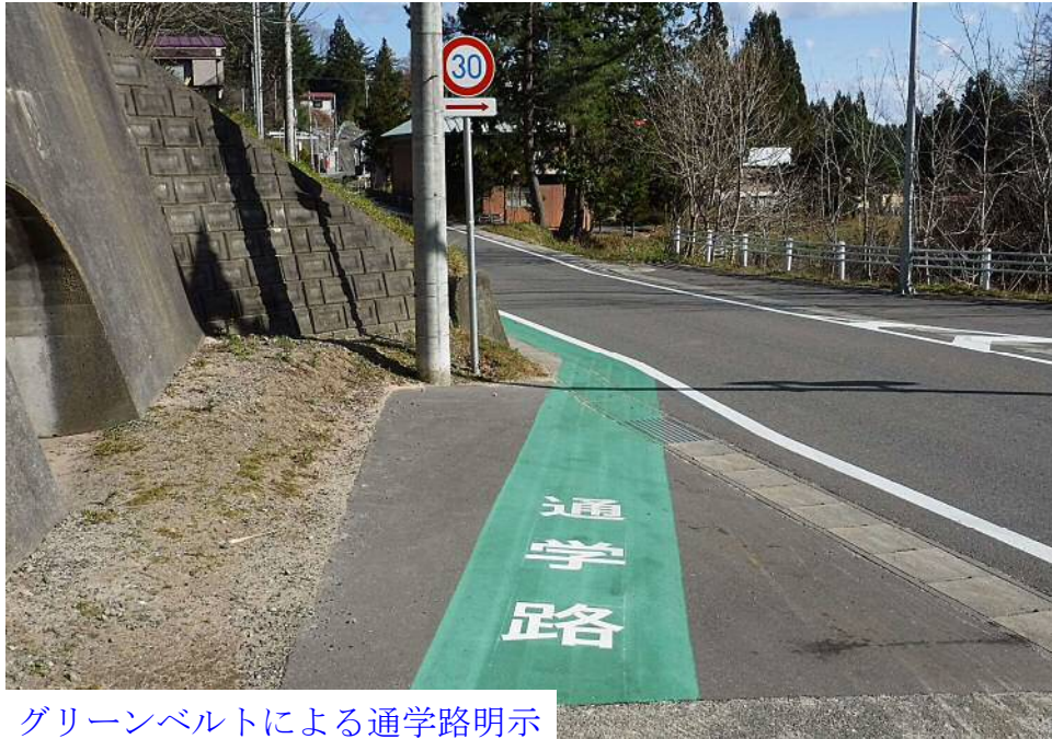
グリーンベルトによる通学路明示