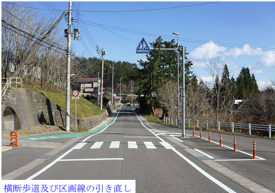
横断歩道及び区画線の引き直し