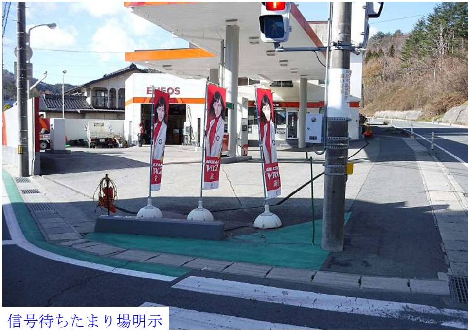
信号待ちたまり場明示