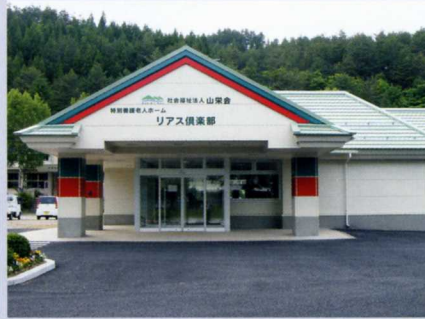
特別養護老人ホーム「リアス倶楽部」