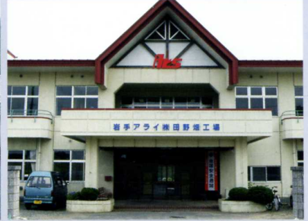
岩手アライ(株)田野畑工場