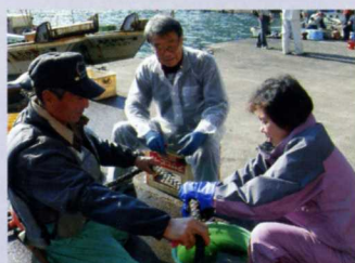
◀ 漁業体験では、ワカメの種巻きなどを実施