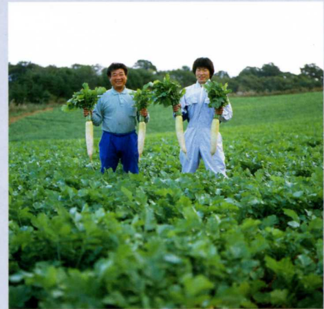
ホウレンソウや大根などの栽培技術を習得できます

補助金の交付決定をした日の翌月から研修の終了月まで、月額 8 万円を生活費として交付します。