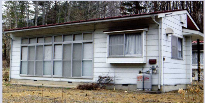
田野畑村営住宅（北山団地の住宅）