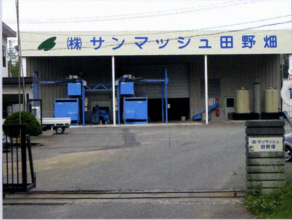
(株)サンマッシュ田野畑

村では平成 21 年度に 3 つの企業を誘致し、22 年度から本格的な操業を始めています。これらの企業をはじめとする村内事業所の求人募集などの情報を紹介します。