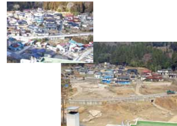
被災前後、ホテル羅賀荘から見た羅賀地区の様子。地区内の約半分にあたる27世帯や多くの漁業倉庫などが被災した(被災後の写真は4月15日撮影)

甲地出身の私。どこかで津波は人ごとのような気持ちもあったかも知れませんが、今回学んだのは、着の身着のままでもいいから、とにかく高いところに早く逃げるといこと。自分のためにも、心配してくれる家族のためにも。