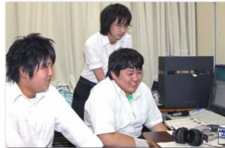
全国大会へ向け作品の最終調整に取り組む放送部の3人