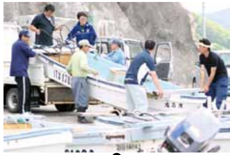
①②16日の早朝4時30分、34隻のサツパ船は朝日に向かって出航 ③松島の南側の海で箱眼鏡をのぞき込み天然ワカメを採取 ④水揚げされたワカメは出荷に向けて選別作業 ⑤前日の15日にはサツパ船の運搬も共同で行われた