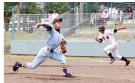
最後まで粘り強く投げ抜いたが惜敗