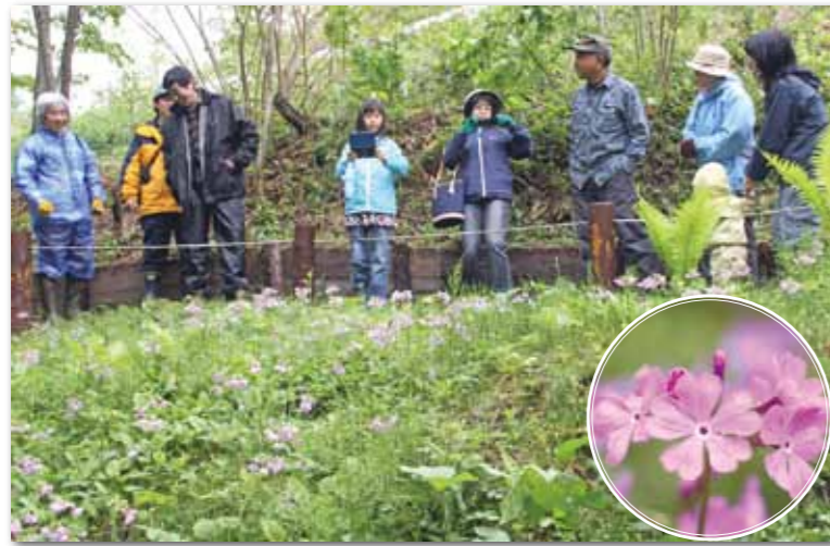
サクラソウを写真に収める参加者の姿も見られた