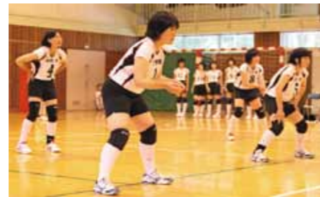
集中して相手サーブに備える