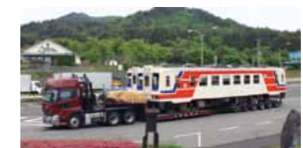
道の駅たのはたに三鉄車両(5月27日)