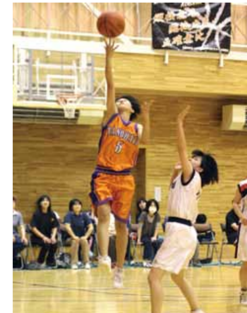
相手ディフェンスをかわしてシュート