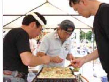
売れ行き好調だった地区の店