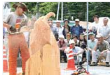
チェーンソーアートに興味津々