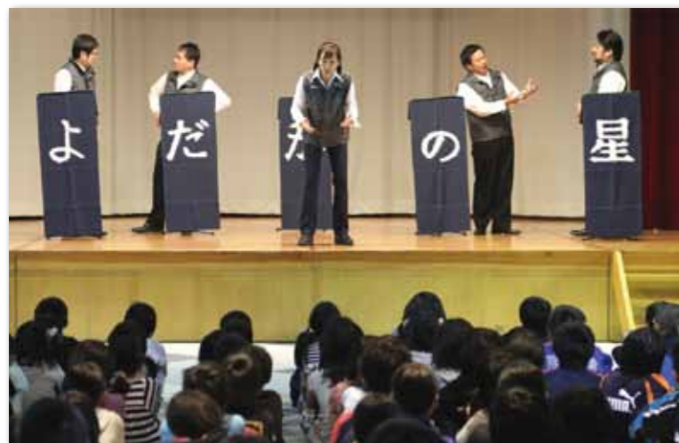
響き渡る歌声と身ぶり手ぶりで会場を魅了