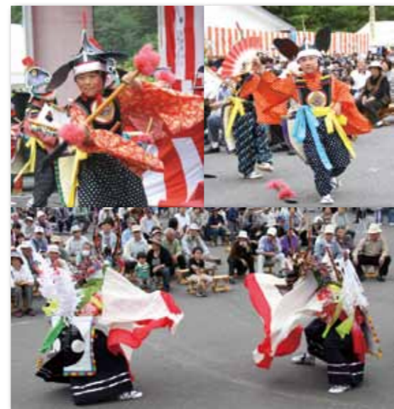
甲地剣舞と甲地鹿踊りは会場を魅了