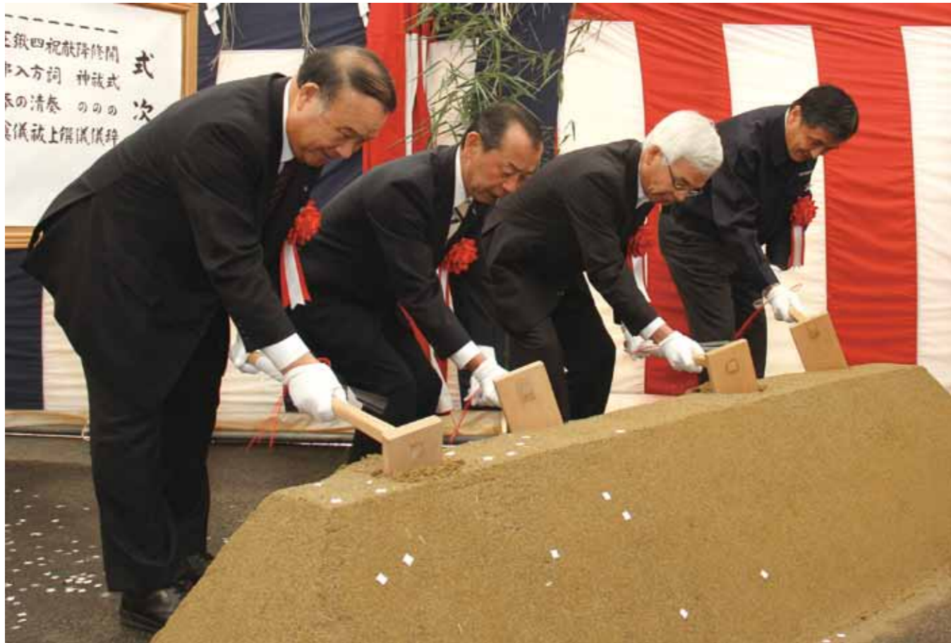
工事の安全を祈願し、くわ入れを行う上机村長(左)や望月社長(左から2人目)