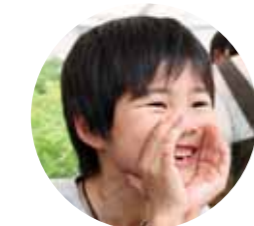
「焼きそばいかがですか〜」 小学生もお手伝い