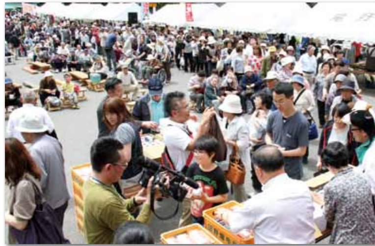
乳製品の無料配布には今年も長蛇の列ができた