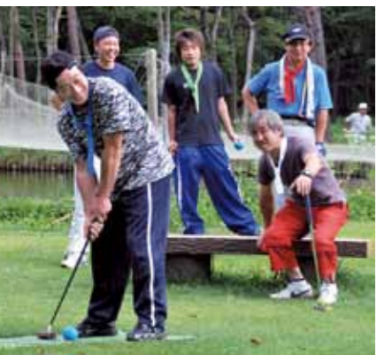
マレットゴルフ大会も開催予定