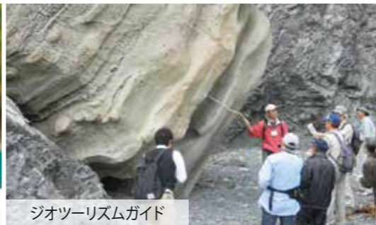
ジオツーリズムガイド