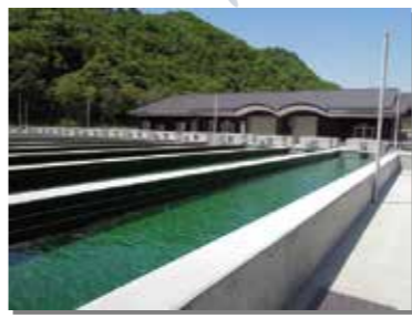
6月14日 平成24年9月から工事を進めていた明戸地区の「村サケふ化場」が完成