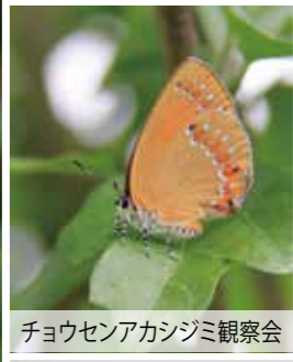
チョウセンアカシジミ観察会