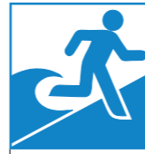
■大津波警報・津波警報・津波注意報の分類