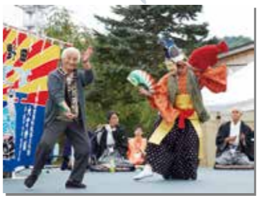
10月5、6日 「村復興祈念祭」を開催。多くの人が訪れ、1日も早い復興を願った