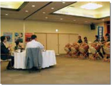
9月3日 「第17回北海道・北東北知事サミット」がホテル羅賀荘で開催された