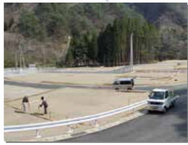
3月29日 松前沢団地の造成工事が完了。4月には災害公営住宅の建築が始まった