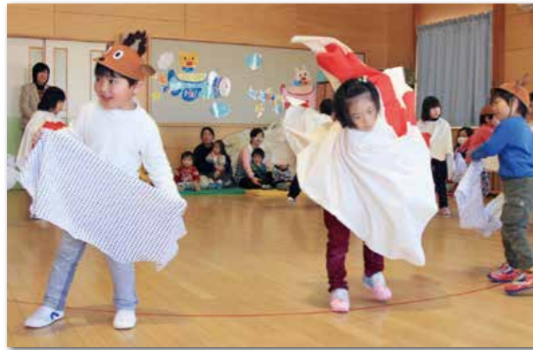
年長児と年中児が一つの輪になり、楽しそうに舞った