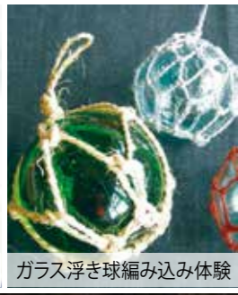
ガラス浮き球編み込み体験