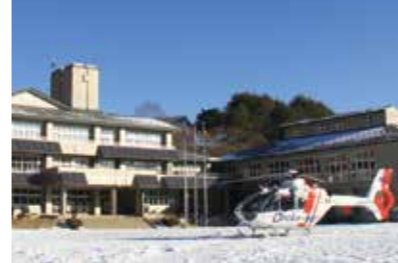
2月6日、田野畑小前にドクターヘリが着陸