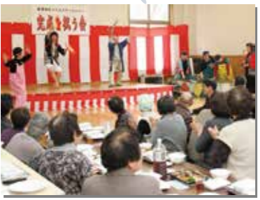
平成26年2月2日 羅賀コミュニティセンターが完成し、地域の皆さんが完成を祝った