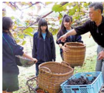
体験村は教育旅行の民泊の受け入れにも力を入れている

▼ 体験村ができて変化 体験村が体験型観光を進める上で、大きかった存在が「机浜番屋群」です。かつては「古くなくて見苦しい」とさえ言われていた番屋も、村外の人から見れば素晴らしい資源でした。 この番屋群を有効活用するため平成17年、漁師文化や北山崎の自然をテーマに体験内容を見直し、「番屋エコツーリズム」として新たな展開を図ります。 サッパ船や北山崎トレッキングに加え、番屋群漁師ガイド、番屋料理体験などを開始。体験者は、初年度100件・434人だったものが、25年度（12月末）には2106件・1万2559人と年々増加し、その滞在時間は延びていきました。 村を訪れる観光客の楽しみ方が、観光地を見て歩くだけの物見遊山の旅から、人とのふれあいや暮らし・文化を学び楽しむ旅に変化してきていることを表しています。