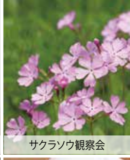
サクラソウ観察会