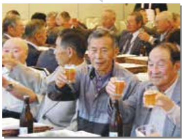
9月16日 村敬老会を開催。75歳以上の約140人が出席し、会食や余興を楽しんだ