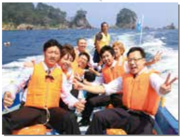
8月15日 第52回成人式。対象者49人のうち37人が出席。大人への第一歩踏み出す