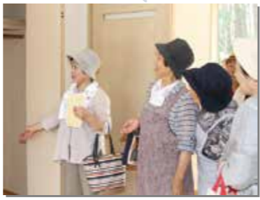
8月6日（写真は見学会の様子） 松前沢団地の災害公営住宅10棟が完成。7月29日には見学会を開催した