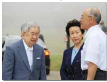
8月5日 常陸宮ご夫妻が来村。北山崎をご覧になり、ホテル羅賀荘にご宿泊