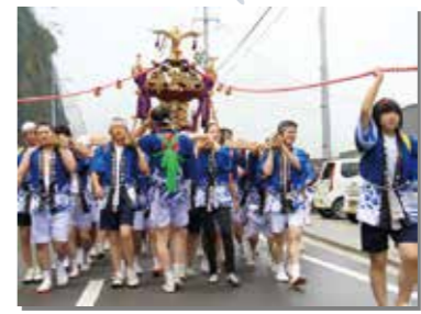
7月28日 3年ぶりに行われた「島越大神宮祭」。漁の安全と大漁、復興を祈願