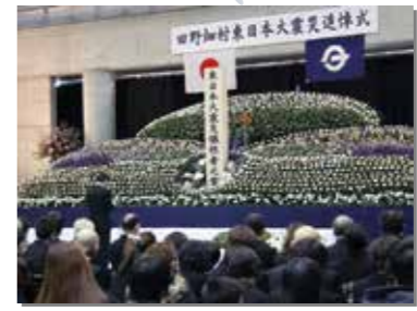
平成25年3月11日 アズビィ体育館で「東日本大震災追悼式」を開催。約350人が参列した