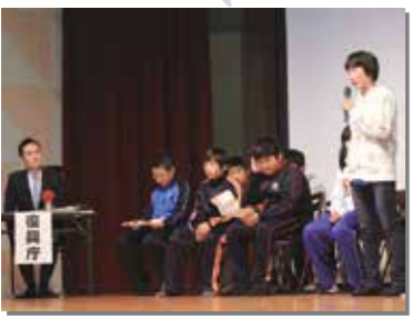
11月2日 「第2回村教育の日のつどい」の復興子ども会議で児童生徒が発表