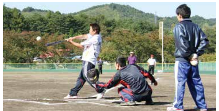
「がんばろう田野畑！耐久ソフトボール大会」の様子（資料写真）

スポーツをする前に、加入をお勧めするのが「スポーツ安全保険」です。 スポーツのほか、文化、ボランティア、地域活動などを行う5人以上の団体が対象。移動の往復途中も含めた活動中の損害事故、賠償責任を負う事故を補償します。 さらに今回、手術保険金の改定が行われ、入院を伴わない手術も支払いの対象となるなど、補償対象が拡大されました。 ◆掛付け金：800～11000円（加入区分で異なります） ◆加入方法：加入依頼書を提出してください。用紙はアズビ学習センターで配布しています ◆申し込み・問い合わせ先：田野畑村体育協会（教育委員会内 ☎34-2226） 保険期間は4月1日から平成27年3月31日までの1年間。もしも備えて加入を検討してみたいかがでしょうか？