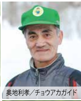
奥地利孝/チョウアカガイド