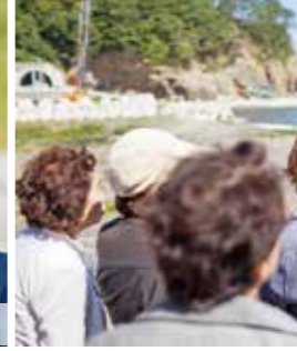
津波語り部ガイド