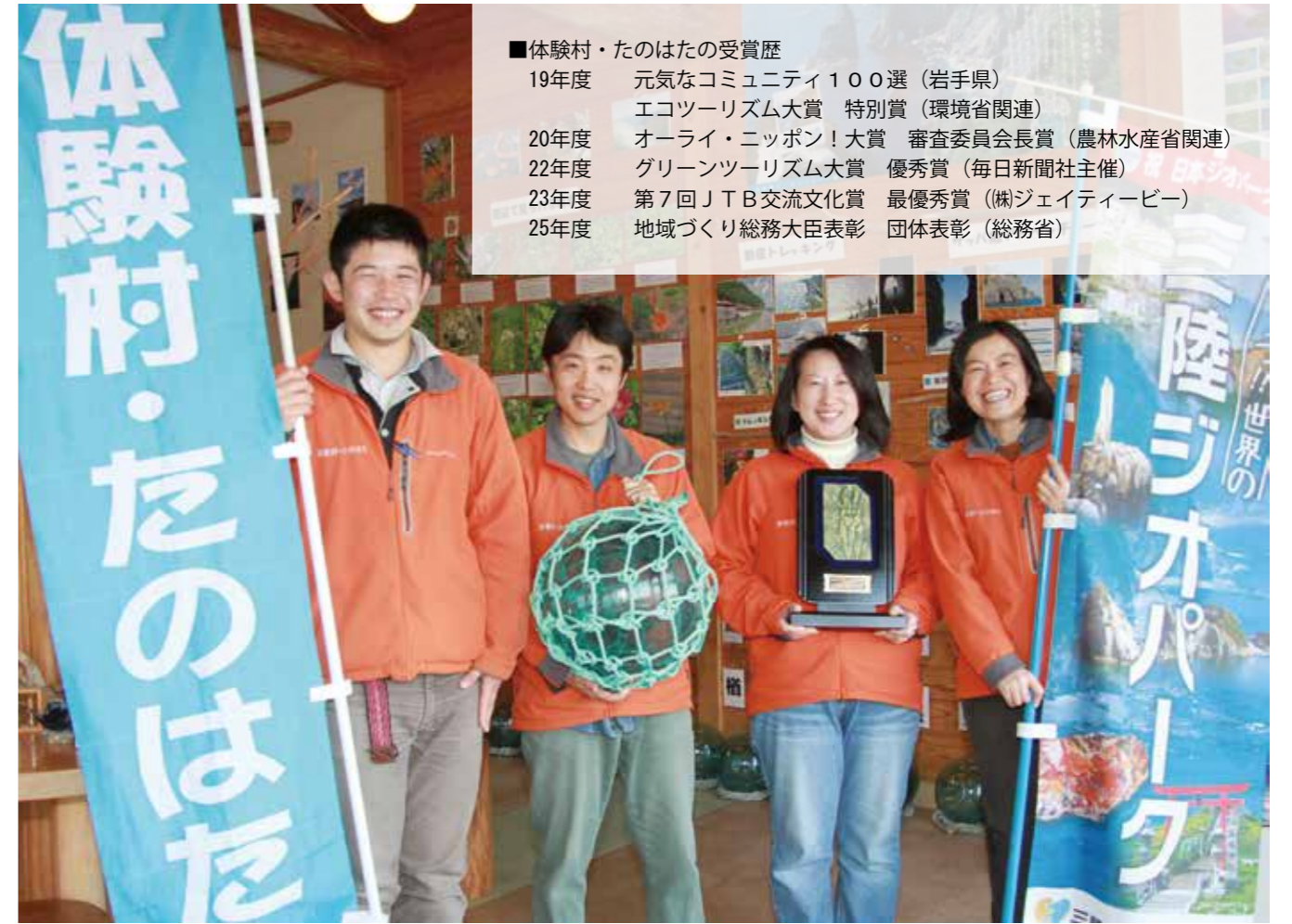
■体験村・たのはたの受賞歴