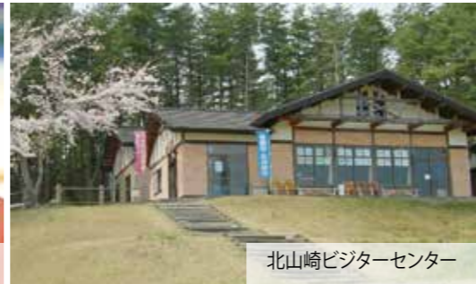
北山崎ビジターセンター