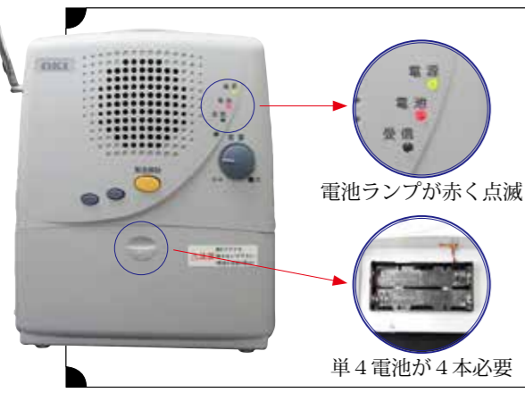
電池ランプが赤く点滅