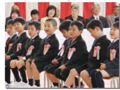
4月 小中学校入学式、児童館入園式など、新生活始まる（写真は小学校入学式）