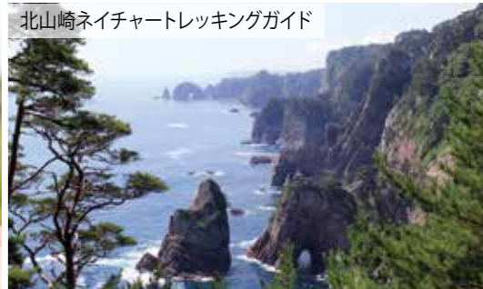
北山崎ネイチャートレッキングガイド