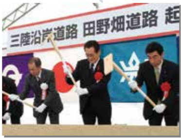
11月7日 三陸沿岸道路「田野畑道路」の起工式が浜岩泉地区で開催された