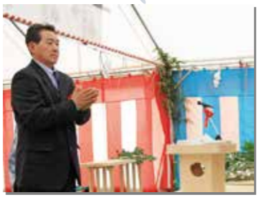
12月11日 明戸防潮堤復旧工事の安全祈願祭。約50人が出席し工事の安全を願った