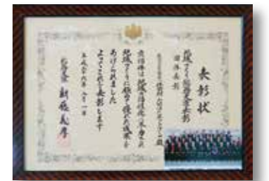
総務大臣表彰の受賞を喜ぶ体験村・たのはたのスタッフの皆さん