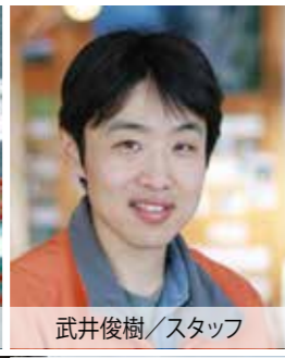
サツパ船アドベンチャーズ