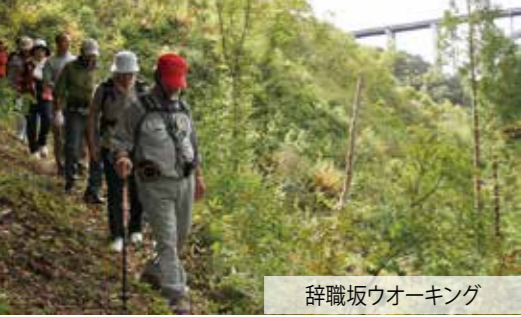
辞職坂ウォーキング