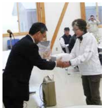
入賞者には景品が送られました

東日本震災で流失した田野畑村マレットゴルフ場が、このように復旧し感激でいっぱいです。多くの被災者の皆さんは復興過程にあり、まだマレットゴルフを楽しむ状況にないかもしれませんが、住宅再建など復興を進めてもらい、復興の暁にはマレットゴルフを楽しんでいただければと思います。今回の再開交流記念大会には村内外から多くのプレーヤーの参加がありました。今後も皆さんが気持ちよくプレーできるような環境を整え、岩手国体に向けて、利用者の増加を図ってまいります。