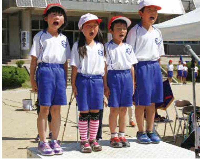
1年生の開会の言葉。みんなハキハキと大きな声で立派でした