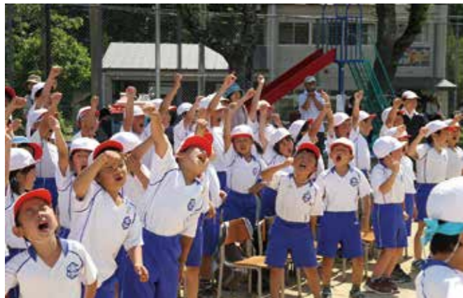
応援合戦で勝利した白組。熱のこもった応援でした