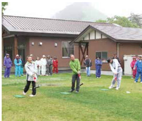
村長などの力強い始球式でプレーがスタート