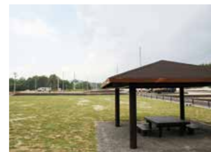
芝敷きの広場と東屋で交流を深める