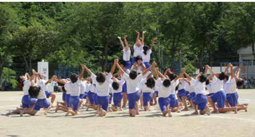
5、6年生の組体操「Let It Go～ありのままで～」会場みんなで「レリゴ～♪」