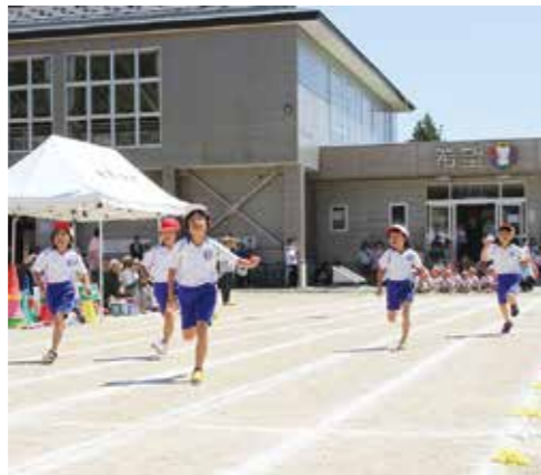
3年生「徒競走」一心不乱にゴールを目指して抜群の快走を見せました