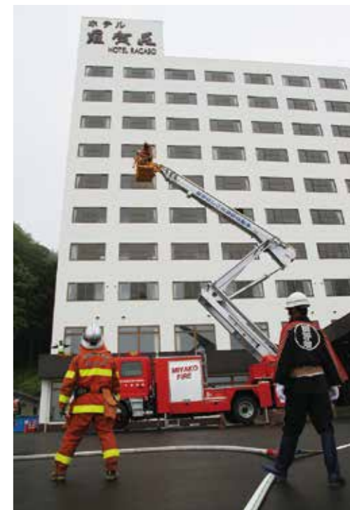
はしごは最長でホテル羅賀荘9階まで(右)