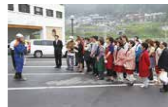
従業員の表情は真剣そのもの