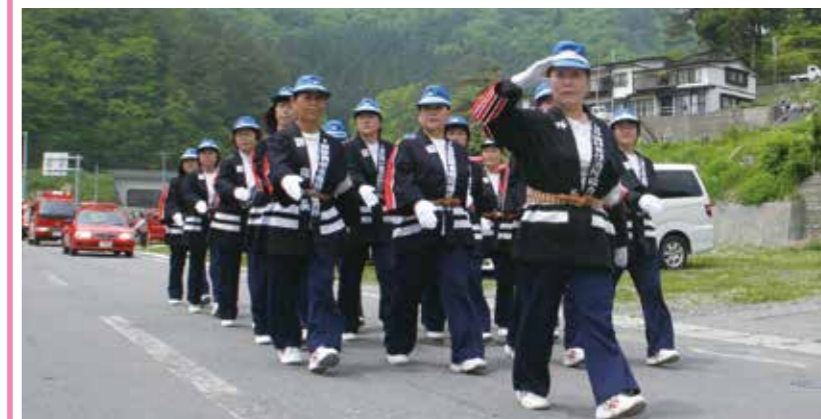
田野畑村女性消防協力隊で女子力アップ！地域に欠かせない消防協力隊

田野畑村女性消防協力隊では隊員を募集しています。田野畑村女性消防協力隊は、家庭内で火の取扱い責任者となることのできる女性が火災予防の知識を身につけ、地域の安全・安心を守るため、平成8年10月1日に発足されました。