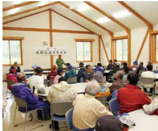
村内外から47人のプレーヤーが集まりました