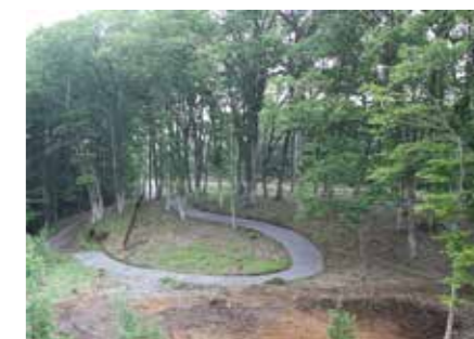
団地の東には森林内を歩く散策路を整備

写真中央の林が金比羅神社。その先に羅賀集落やホテル羅賀荘、羅賀漁港があります(右)