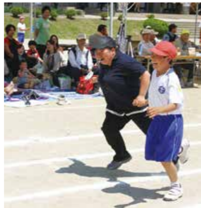
6年生「あなたとデート♡」ではお母さんとデートした児童も♡