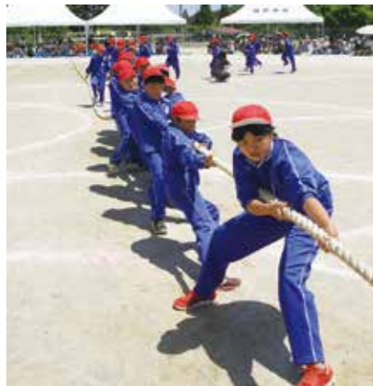
5、6年生「風林火山2014」男子に負けない女子パワーが炸裂しました