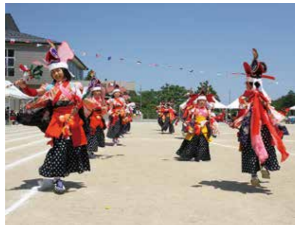
「大宮神楽～綾遊び～」羅賀地区の児童が優雅に舞いました