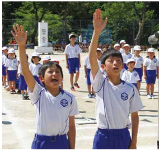
選手宣誓は赤白両組を引っ張るリーダー