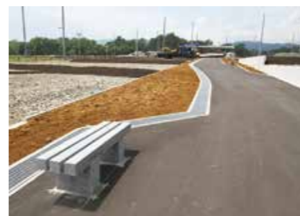
団地内には歩行者専用の道路も

主に羅賀地区の被災者が居住予定の拓洋台団地。自力再建住宅12戸、災害公営住宅20戸の計32戸の住宅が建設予定