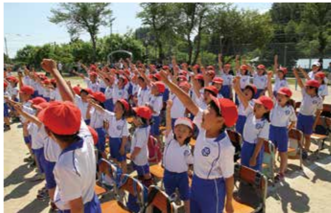
低学年から高学年まで一緒になって応援した赤組