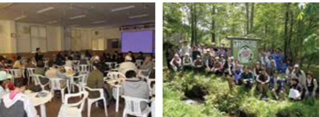
サクラソウ愛が感じられた実践発表(左)と参加者の皆さん(右)

5月24日「第10回野生サクラ草サミット田野畑大会」が全国からの愛好家約60人が参加し開催されました。 サミットは岩手県内の自生地を会場に毎年開催されており、村では第6回大会以来4年ぶりの開催。午前は田代地区の自生地を観察会が行われ、保護活動の説明や株分けして自生地を徐々に拡大している様子、サクラソウ以外の希少植物の紹介などがありました。また田代自治会から山菜や牛乳の差し入れがあり、サクラソウが地域活性化に一役買っていることが垣間見られました。