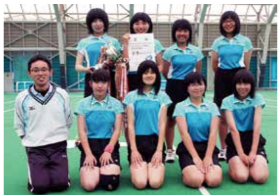
団体、個人とも県大会出場的女子ソフトテニス部

6月14日、本村と岩泉町の五つの会場で行われた第61回下北地区中学校総合体育大会が開催されました。