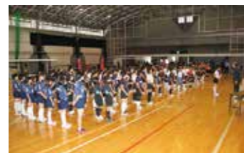
16チーム、157人がエントリー