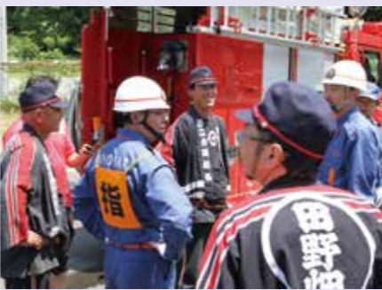
タイム、規律とも完璧な操法に見ていた団員は勝利を確信(右)

岩手県消防協会宮古地区支部消防操法競技会 自動車ポンプの部 2分団1部(鳥越) 2位 小型ポンプの部 4分団(田野畑) 2位