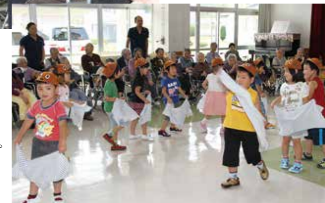
鹿をイメージした帽子が超キュート。踊りは緊張気味でした（笑）