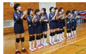
声を出して気合いを入れる田野畑VBCの選手たち