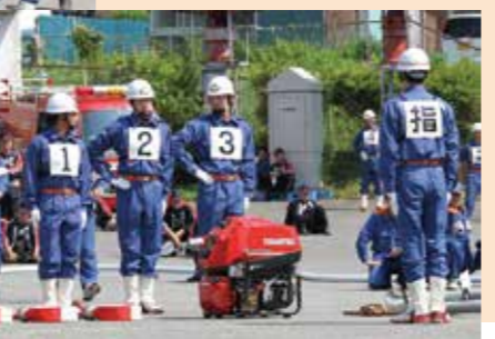
小型ポンプの部、1番目の披露だったが、ミスのない安定した操法は他の参加団の重圧となりました