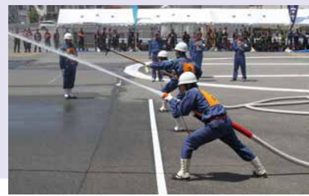
第1、2線とも練習どおりのタイムで火点を射止めました