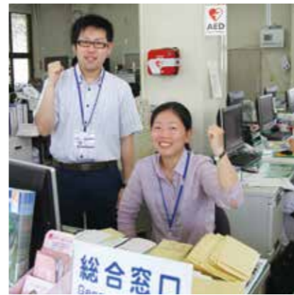
村の復興を一緒に成し遂げよう！

平成27年度採用予定の「田野畑村職員」と「宮古地区広域行政組合消防職員」の採用試験を実施します。受験を希望する人は忘れずに申し込んでください。