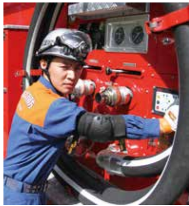
安心安全の地域づくりを共に！