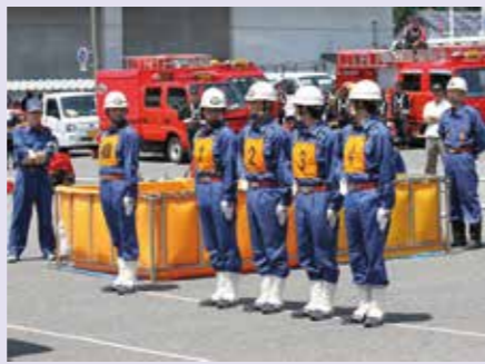
終始緊張感がみなぎり、きびきびとした操法をみせました