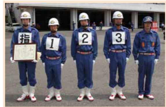
4分団は初めての県大会出場。歴史に名を刻みました