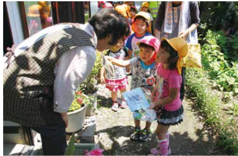
30度近い暑さの中、メッセージを受け取った人も交通安全を誓いました