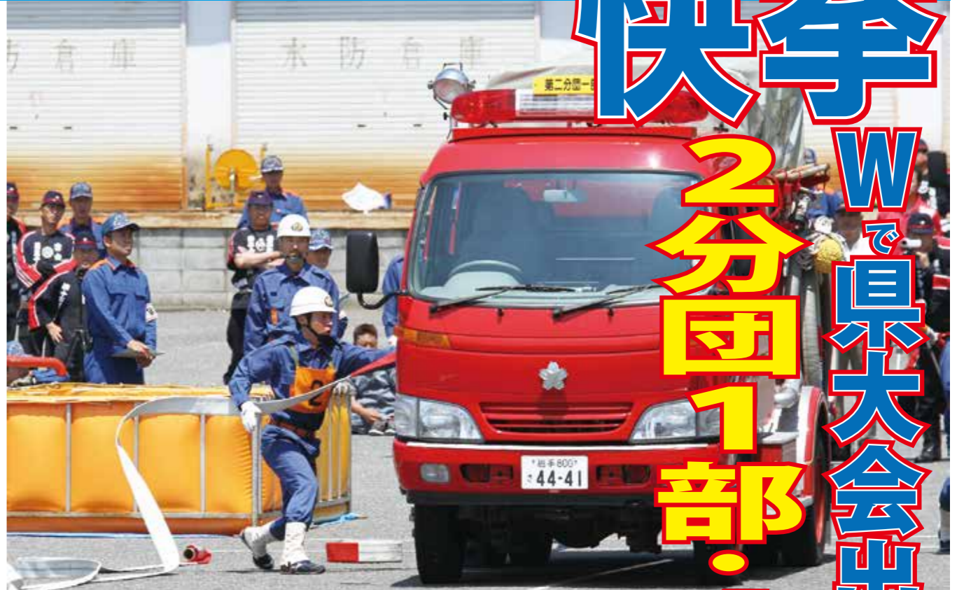
ポンプ車周りを素早く処理し、好タイムにつなげた2分団1部