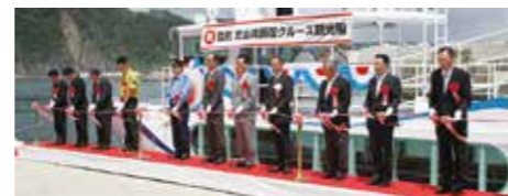
テープカットで就航式の盛り上がりは最高潮