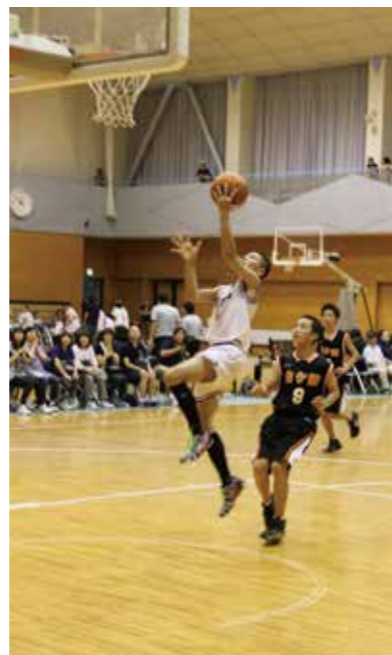
男子バスケットは善戦するも惜敗