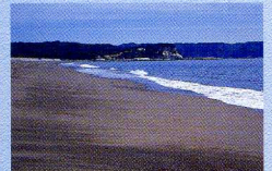
【野田村】十府ヶ浦海岸

世界の琥珀(こはく)で作った芸術品や空飾品、太古の自然を封じ込めた虫入り琥珀(こはく)などが展示されています。