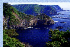
【岩泉町】熊の鼻(小本海岸)展望台

地球全体の繁栄と平和への願いが込められた高さ4mの地球儀型。塔に近づくセンサーが人の気配をキャッチし、ゆっくりと回転しながら歓迎してくれます。