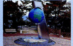
【普代村】北緯40度のシンボル塔

高さ150mから200mにおよぶ断崖が太平洋にはほぼ垂直に落ち込んでいる岬の突端には黒崎灯台が立ち、黒崎展望台からは久慈へと延びる海岸線を一望できます。