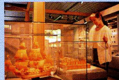
【久慈市】久慈琥珀博物館

世界の琥珀(こはく)で作った芸術品や空飾品、太古の自然を封じ込めた虫入り琥珀(こはく)などが展示されています。