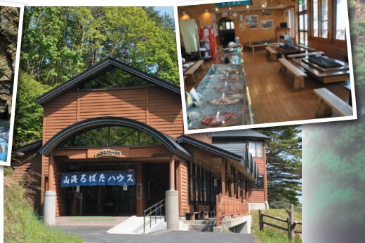
山海ろばたハウス