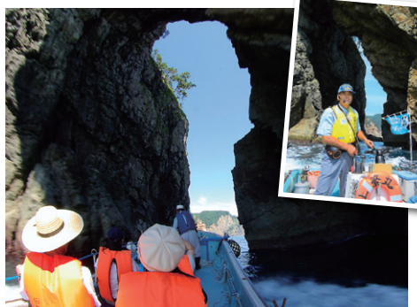
サッパ船アドベンチャーズ