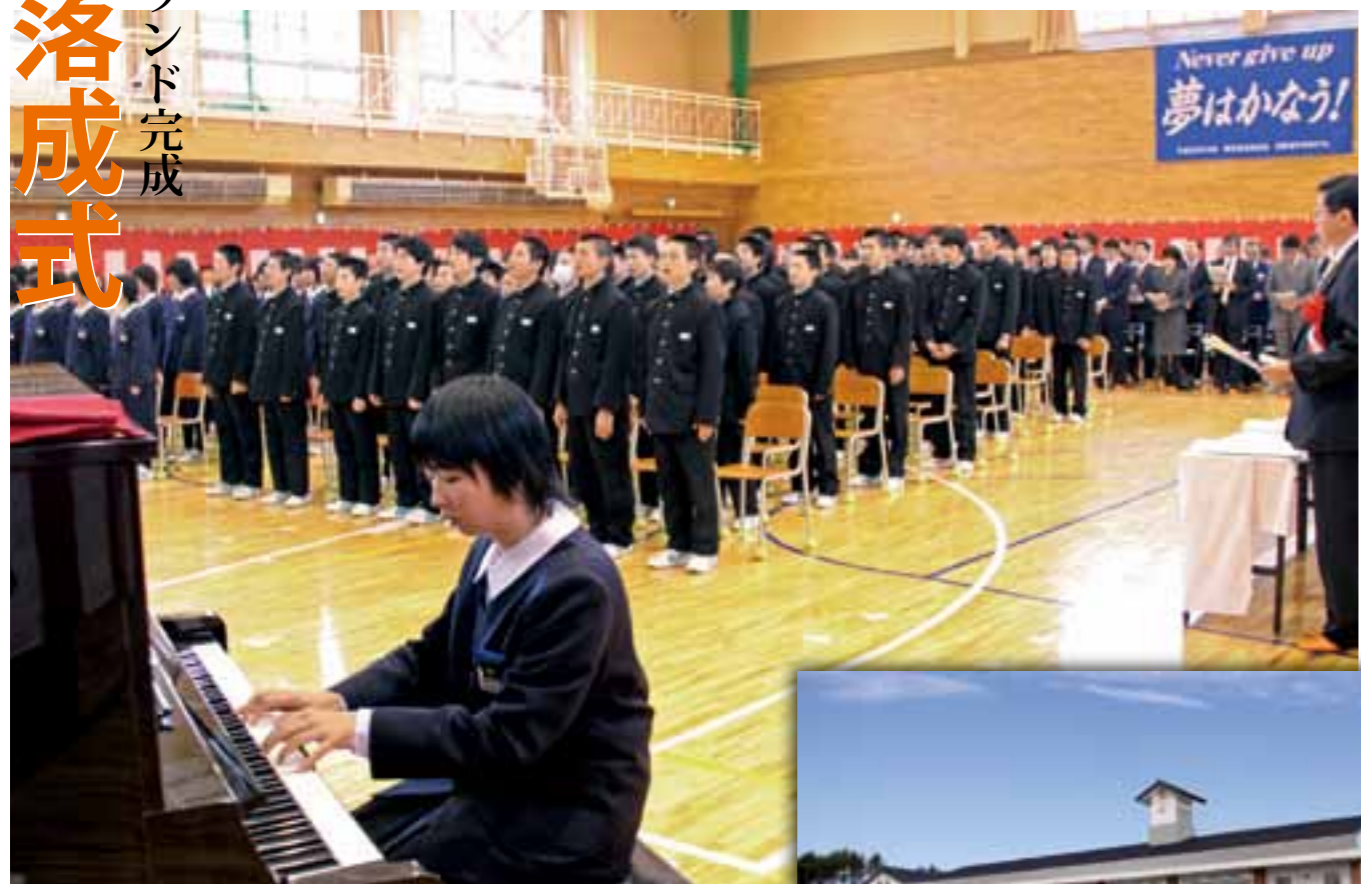
①式典の最後は出席者全員で校歌を斉唱し発展を誓った ②青空と木々の緑に良く映える白亜の校舎