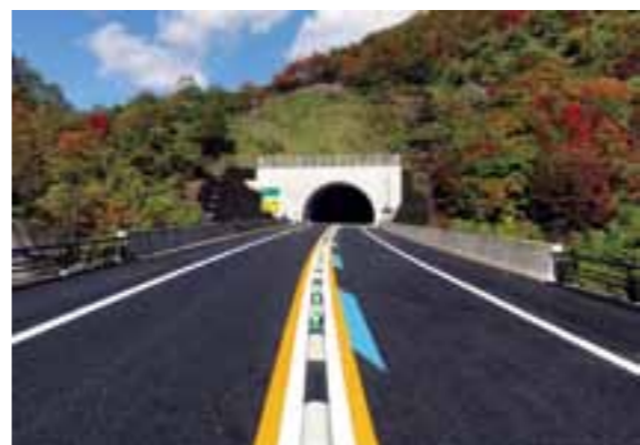
小本方面から見る岩泉トンネル入口（長さ1,986m）

11月28日には、三陸北縦貫道路「中野バイパス」が全線開通しました。この道路は、岩泉町小本地区から本村大芦地区を結ぶ延長6.2キロの自動車専用道路。途中、岩泉トンネル（延長1986メートル）など3本のトンネルが整備され、急カーブ急こう配が続く交通の難所「中野坂」を回避。快適で安全・安心な走行ができるようになりました。この開通によって、大芦―小本間は約400メートル・5分の短縮