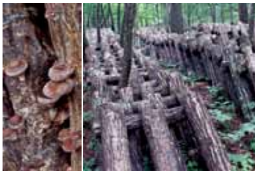
自然に近い形で栽培する原木シイタケ

季節を問わず、菌を植え付けてから約120〜130日で収穫。資金の回転が早いので「専業」経営も可能です。さらに、菌床ブロックは原木に比べてかなり軽量です。狭