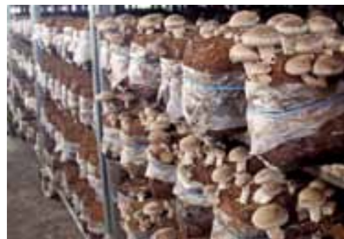
施設内で棚に並べて栽培する菌床シイタケ