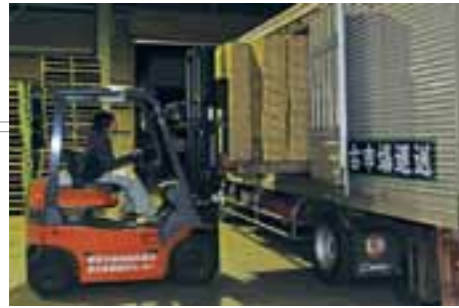
集荷した菌床シイタケをトラックに積み込んで関東や東北の市場へ出荷