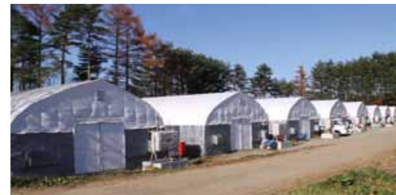
広い農地を活用して菌床シイタケ栽培用のハウスが立ち並ぶ

村の皆さんには、おいしいシイタケをもっと食べてほしいです。「産直プラザ思惟大橋」に毎朝、新鮮なシイタケを出荷しています。ぜひ味わってください。