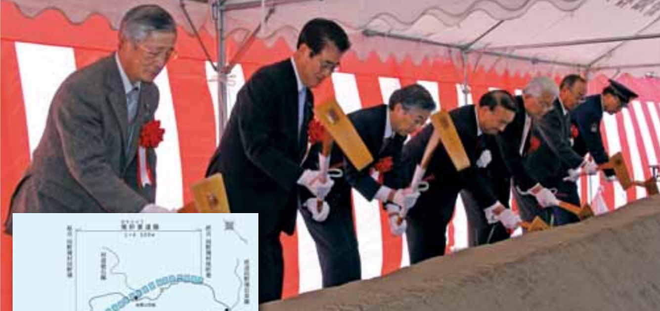
尾肝要道路の早期完成、工事の安全を願ってかわ入れを行った