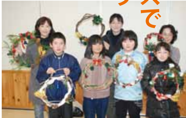
すてきなリースを作ろう (昨年度の様子)