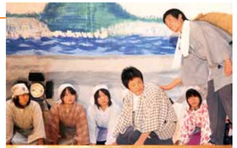
生徒たちの熱演に、会場では目頭を押さえる姿も見られました

田野畑中(佐々木幸彦校長、生徒121人)の文化祭は10月31日、「協創~121人の心の響鳴~」をテーマに同校で開催されました。午前中に行われた合唱コンクールでは課題曲と自由曲をクラスごとに合唱。体育館にきれいなハーモニーを響かせました。午後は全校創作劇「みちのくの鼓動」を上演。生徒全員が役者やスタッフを担当して「弘化の一揆」から「嘉永の一揆」の間に繰り広げられる人間模様を熱演し、会場を大きな感動の渦に包み込みました。