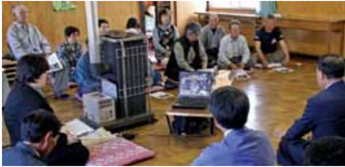
昨年度の村民懇談会の様子(尾肝要)