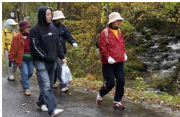
色づく木々や溪流の流れを楽しみながら歩く参加者

溪流紅葉ハイキング(体験村・たのはた主催)は11月3日に開催されました。盛岡市や村内などから参加した43人は、三沢地区から甲地公民館まで約4.5キロを2時間かけてハイキング。小雪舞う肌寒い天候でしたが、紅葉や溪流を見ながら歩き、クリやギンナンを拾うなど田野畑の秋を感じていました。甲地公民館では、地区の女性たちが手作り豆腐で「八杯汁」を作りおもてなし。参加者は心も体も温まるもてなしに笑顔を見せ、何杯もお代わりをしていました。