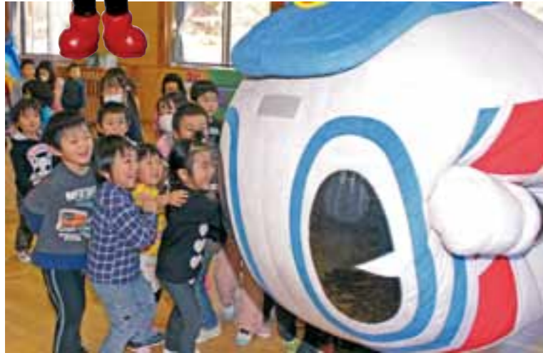
若桐保育園では園児とさんてつくんが「ダルマさんが転んだ」で遊んだ