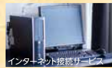
インターネット接続サービス