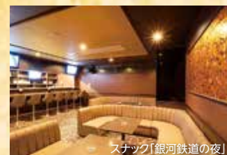
スナック「銀河鉄道の夜」

スナック「銀河鉄道の夜」は50名くらいまで収 容可能。種類豊富なお酒とカラオケで、楽しい 夜を過ごしていただけます。ちょっとお腹が空い た時は、夜食処「はまなす」へ。麺類、ご飯もの、 一品料理など幅広いメニューを揃えています。