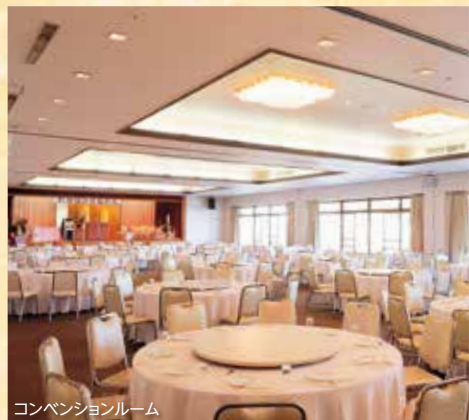
コンベンションルーム

ゲストを最初にお迎えするのは、開放的で明るいロビーラウンジ。 ここから、至福の時間が始まります。