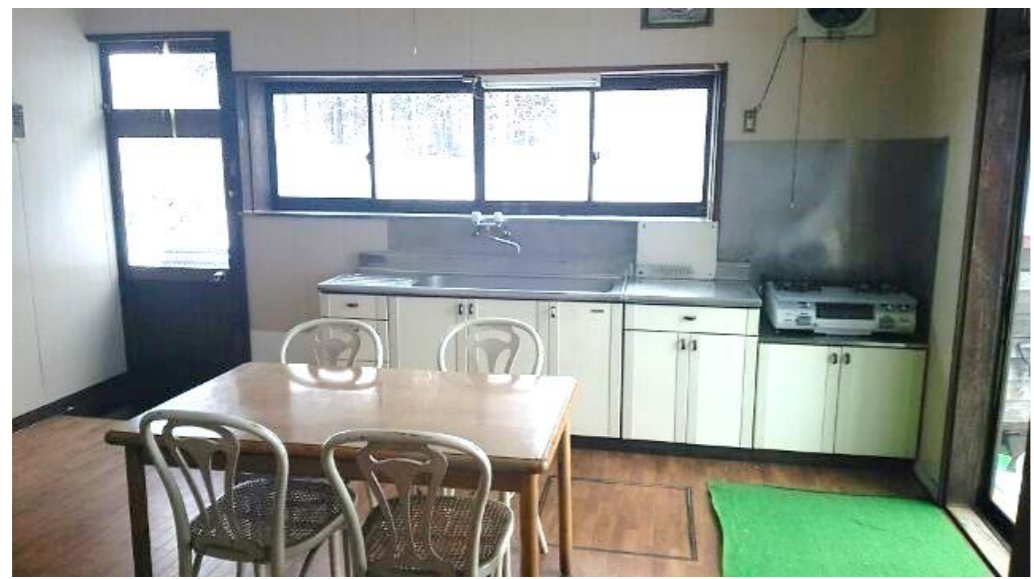
1階 ダイニングキッチン