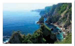
北山崎 高さ200mもの断崖に、太平洋の荒波洗う奇岩怪石、大小さまざまな海蝕洞窟と、ダイナミックな海岸線が約8kmにもわたり続きます。