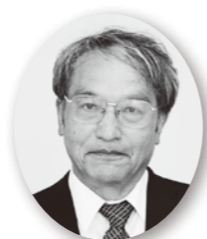
中村 勝明 議員

【問】福島第一原子力発電所の処理水・海洋放出方針について、村が把握している動き、状況は。 【村長】今年4月、政府の基本方針として処分方法を海洋放出とした決定が示された。これに対し、本村議会をはじめ、県市長会、県町村会など、さまざまな団体から国に対し、要望書や意見書など提出された。国では、関係者に対し説明会を開催し、意見を徴収しながら理解を広げたいとの意向を示している。村としては、引き続き積極的かつ慎重に対応したい。 【問】尾肝要産直・特産品加工場の工事が進んでいる。雇用などを含めた今後の経営方針は。 【村長】(一社) 思惟の風(施設の貸し付け、運営を予定)が主体的に計画するが、行政としても支援する。従業員は、同法人が雇用。雇用などは、現在の道の駅従事者と併せて、専門アドバイザーの指導をいただきながら慎重に検討していると同っている。