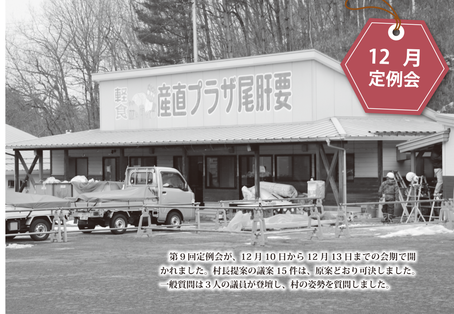
第9回定例会が、12月10日から12月13日までの会期で開かれました。村長提案の議案15件は、原案どおり可決しました。一般質問は3人の議員が登壇し、村の姿勢を質問しました。