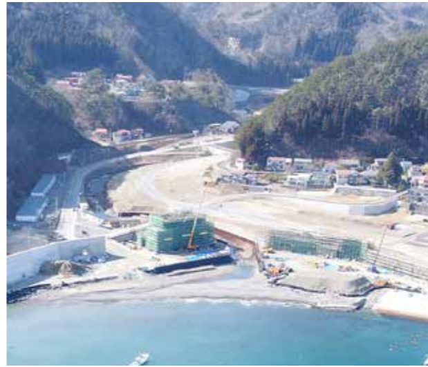
平井賀防潮堤工事の様子(3月12日撮影)

東日本大震災からの復旧・復興事業については、台風10号被害の復旧工事が本格化し、コンクリートなどの資材や現場作業員が不足する状況が続いています。これにより施工中の復興工事の進捗にも遅れが生じていますが、大型工事の防潮堤整備を除く大方の事業は、30年度で完了する見込みであり、マンパワーを確保しながら早期完成に向けて、事業を推進していきます。