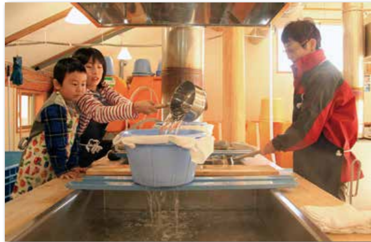
自分たちでくんできた海水を釜に移す作業