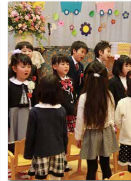
大きな声でお別れの歌（若桐保育園）