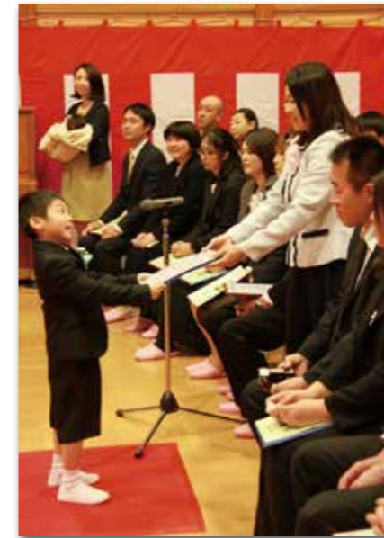
お母さんありがとう（たのはた児童館）