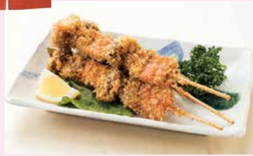
グランプリ 柄っえーの串揚げ サンマッシュ田野畑