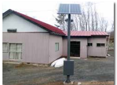
田野畑地区公民館前に設置された街路灯