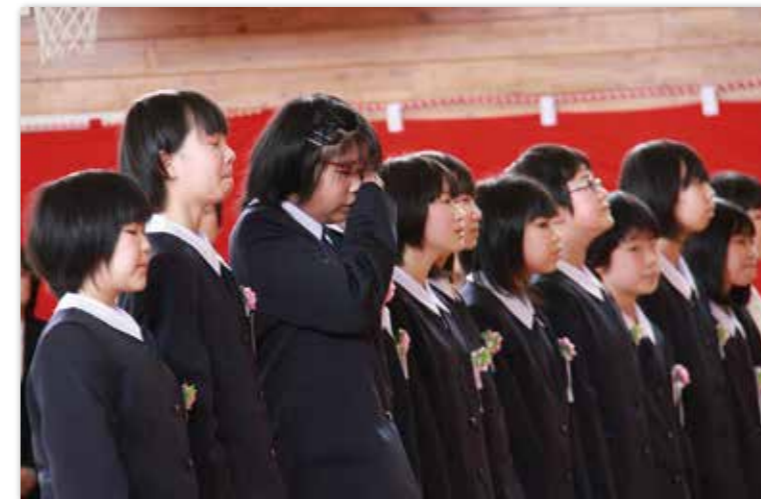
涙を拭きながら、最後の校歌を歌う（田野畑小）

たのはた歴史満載ツアー（体験村・たのはた主催）が3月10、11の両日、机浜番屋群などで行われました。盛岡市や久慈市などから訪れた参加者は、水くみやまき割りなど2日間かけて作る本格的な塩づくり体験や料理づくり体験、大宮神楽の見学などのプログラムを体験。11日は、津波語り部に参加し、東日本大震災の地震発生時刻にあわせて黙とうを行いました。参加者は「あらためて田野畑村の魅力を知ることができた」と満足した様子でした。