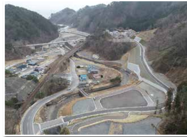
12月15日に開通した、羅賀地区の村道海鳴台線。災害時には、孤立解消の避難路として期待される