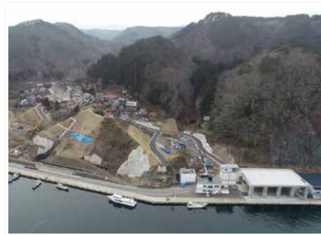
島越地区の避難路整備の様子。平成30年度内の完成に向け工事が進む