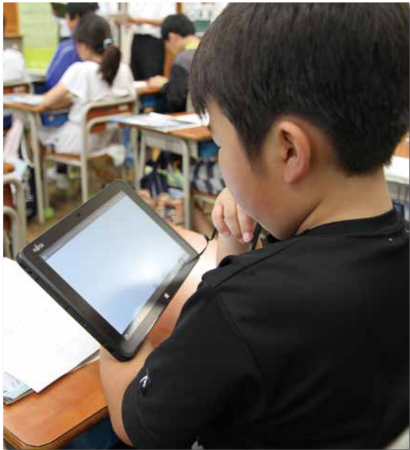
小学校でのタブレットを使った授業の様子

大型工事である平井賀漁港（平井賀地区）の海岸施設災害復旧工事・防潮堤工事は32年度までの完成を目指し、工事を進めます。孤立解消道路として整備している村道尾野北山線（村道長峰線改良舗装工事区間）については、池名工区の道路舗装工事と一の渡交差点の見直し改良工事を行い、年内の供用開始を目指します。県道岩泉平井賀普代線の羅賀工区は、現在、県事業として上層路盤などの施工が加わり、完成に向けて工事を進めているところであり、30年度は、付随する内陸側の用地を造成し、羅賀地区漁業者の希望を伺いながら水産共同利用施設などを整備します。 仮設店舗に入居している事業者に対しましては、引き続き店舗の貸し付けを行い、本設営業再開に向けた相談などに対応します。 台風10号被害の復旧状況については、本年度中に2河川3カ所と6路線11カ所の工事を終える見込みであり、災害復旧事業の最終年となる30年度は、残りの2河川2カ所と8路線16カ所の工事を進めます。