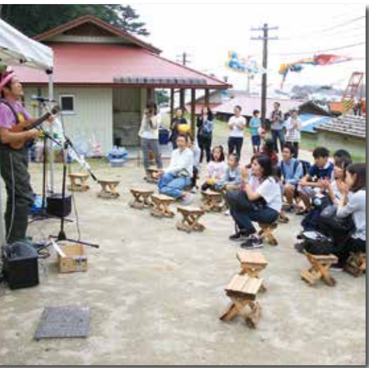
昨年8月に開催した番屋フェス

若者交流については、昨年8月の「サツパ船・番屋まつり」（体験村・たのはた主催）に合わせて開催した「番屋フェス」が好評であったことから、事業規模を拡大し、村と交流のあるアーティストなどを招き、若者の参画による音楽を中心としたイベントを開催します。