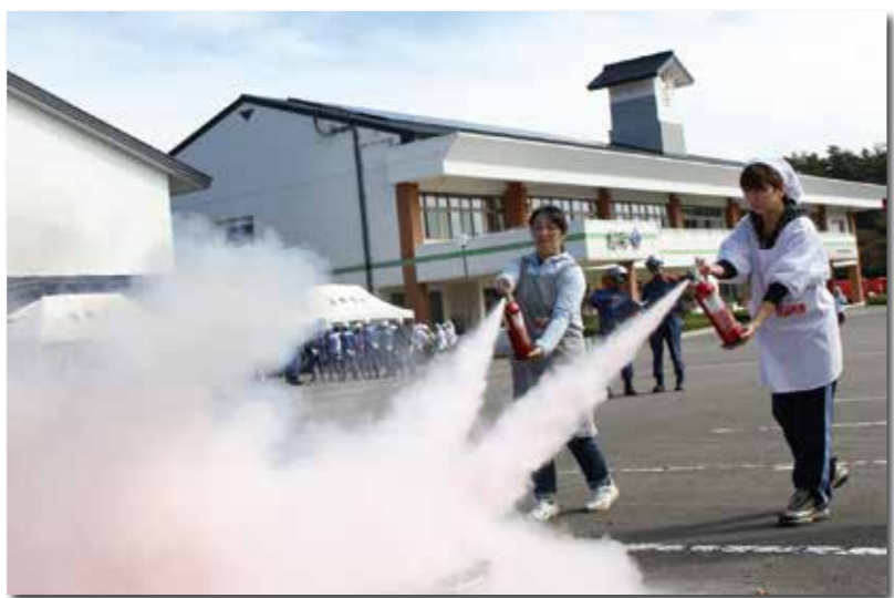
昨年9月に行われた村総合防災訓練。初期消火訓練の様子

東日本大震災や台風10号にみられる未曾有の自然災害が想定される今日、「生命尊重」