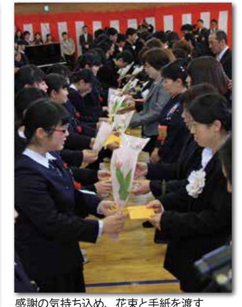
感謝の気持ち込め、花束と手紙を渡す（田野畑中）