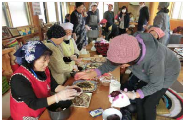
南部町の住民から郷土料理を教わる参加者