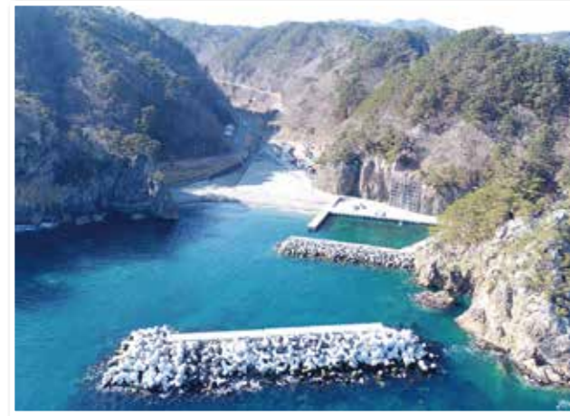
東日本大震災で決壊した机漁港沖防波堤は、1月31日に復旧工事が終了

村全体が大きな悲しみや、不安に包まれたあの日から7年。日本全国、世界各地からの支援に支えられ、少しずつですが、でも確実に、一歩一歩前に進んできました。村は1日も早い復興に向けて復旧工事などを進めています。