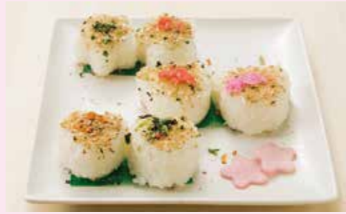
グランプリ 鮭の中骨缶詰のふりかけ 浜岩泉浦漁協女性部