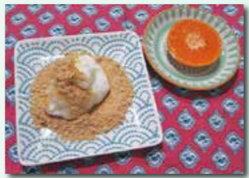
↑ ミルクもち ↓