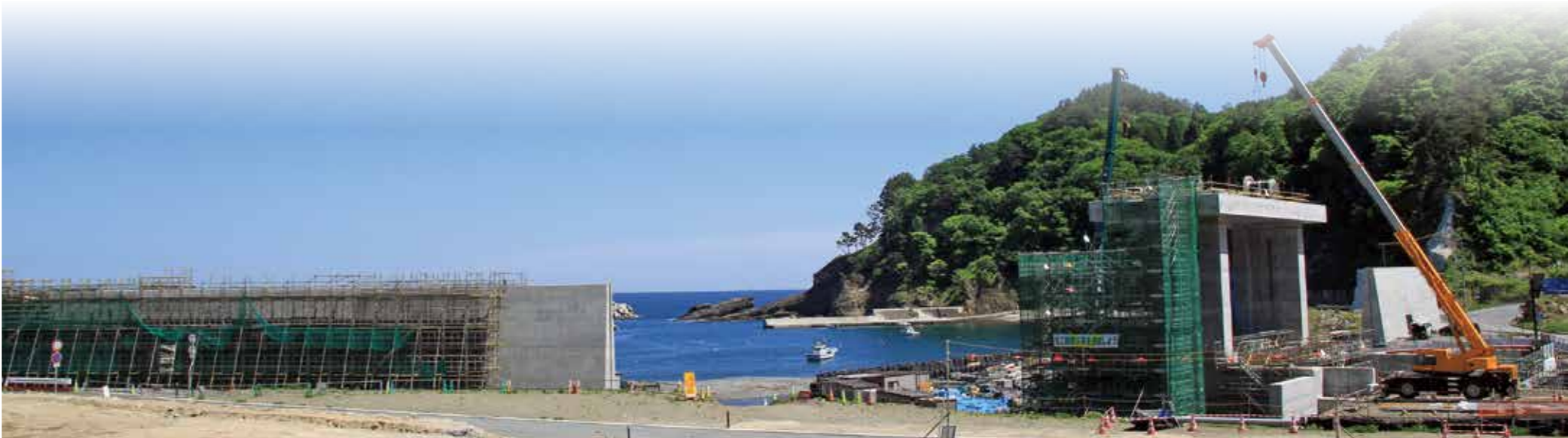
平井賀漁港海岸施設（防波堤）災害復旧工事の様子。平成32年度内の完成を目指し、建設が進む（5月26日撮影）

（1億3431万円）、社会資本整備総合交付金事業（村営住宅整備事業）（7599万円）、平井賀漁港地区漁業集落防災機能強化事業（3608万円）などの減額となっています。