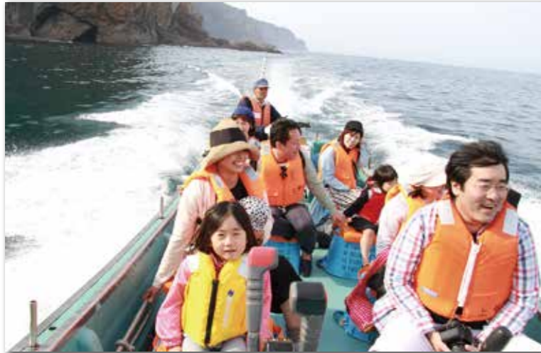
番屋・サッパ船まつり期間中、サッパ船アドベンチャーズには約350人が乗船