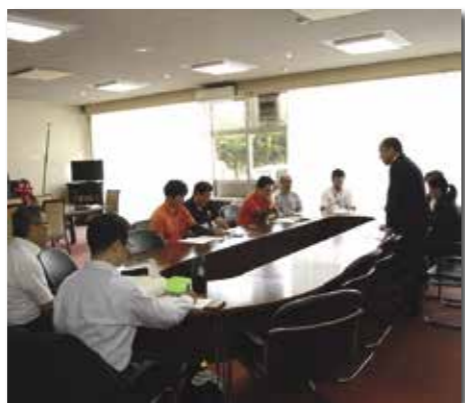
村役場で行われた設立総会

村は6月19日、三陸ジオパークの魅力発信のための体制強化を目的に、田野畑村三陸ジオパーク推進協議会を設立しました。