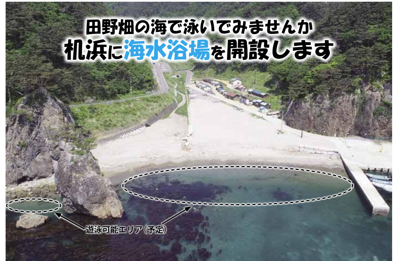
遊泳可能エリア(予定)