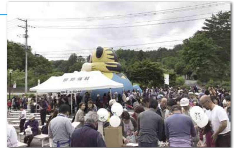
長蛇の列ができた、たのはた牛乳などの無料配布

牛乳・乳製品フェア(村産業開発公社主催)は6月17日、尾肝要地区のミルクプラント敷地内などで行われました。イベントでは、普段は見ることのできない工場内の見学や数種類の牛乳とヨーグルトの中から、たのはた牛乳とヨーグルトを当てる、きき牛乳大会などが行われました。たのはた牛乳とアイスクリーム、たのはたヨーグルトの粉末を使用した焼き菓子の無料配布には約250人が行列を作り、受け取った参加者は笑顔を見せていました。