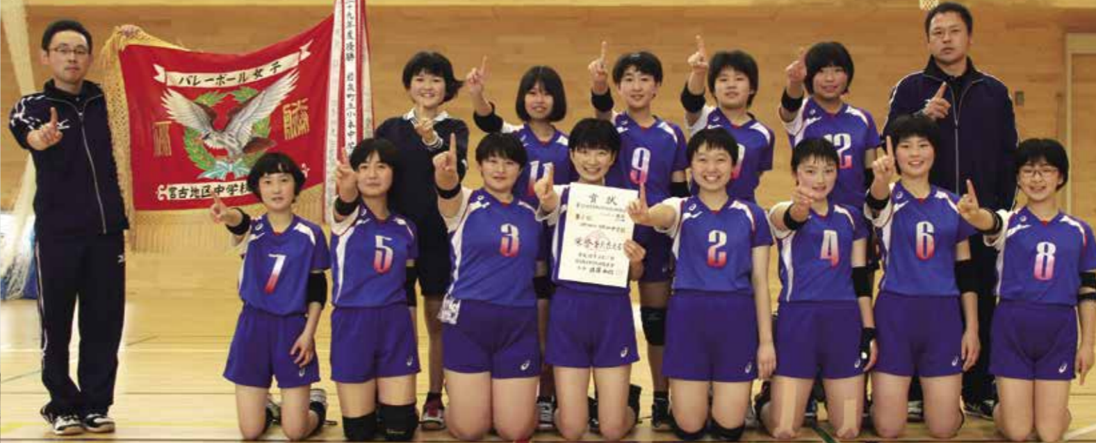
●女子バレーボール部 優勝 決勝トーナメント 予選リーグ 1回戦 田野畑 2-0 河 南 第1試合 田野畑 2-0 宮古二 第2試合 田野畑 2-0 豊間根 準決勝 田野畑 2-0 川 井 決勝 田野畑 2-0 小 本