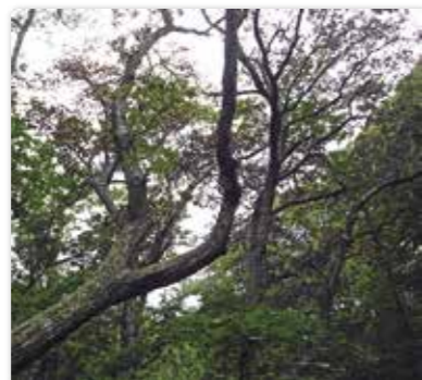
夏に葉が褐色に変色する