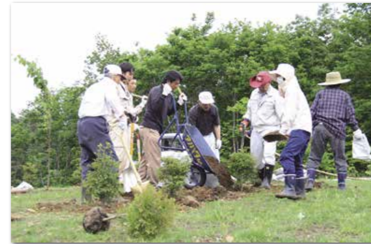
新しく整備された道路敷地内に植樹を行う参加者の皆さん

村は6月5日、村道田野畑インター菅窪線の道路環境整備を行い、三陸沿岸道路田野畑インターから国道45号に接続する村道敷地内に、ヤマザクラ30本とドウダンツツジ30本を植樹しました。参加したのは、田野畑と西和野、菅窪の3自治会と三陸沿岸道路の工事や設計を受託する6社など約50人。村森林組合の職員から植樹方法の説明を受けた参加者は、5カ所に分かれ植樹しました。植樹したヤマザクラは、岩手県土木技術振興協会から寄付されたものです。