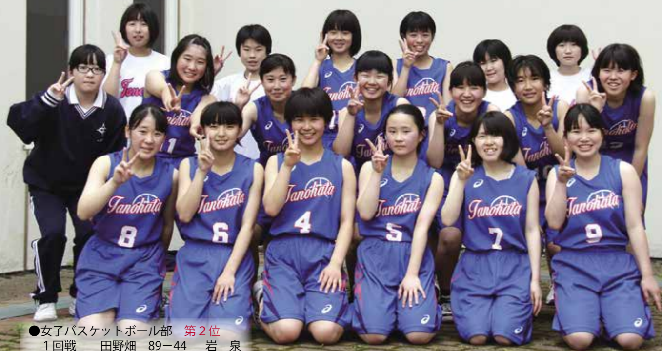
●女子バスケットボール部 第2位 1回戦 田野畑 89-44 岩 泉 準決勝 田野畑 83-69 河 南 決勝 田野畑 44-110 山 田