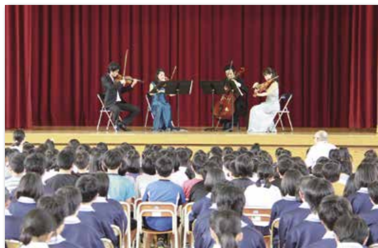
児童生徒の前で演奏するレスパス弦楽四重奏団の皆さん

青少年劇場(日本青少年文化センターなど主催)が6月20日、田野畑小学校体育館で開かれ、田野畑小と田野畑中の児童生徒231人が弦楽合奏を鑑賞しました。演奏したのは、国内各地で公演を行っているレスパス弦楽四重奏団。クラシックの名曲やアニメの主題歌など約10曲をバイオリン、ピアノ、チェロの弦楽器で奏でました。演奏の途中では、演奏に合わせて、児童生徒がそれぞれ合唱を披露。体育館にきれいな歌声を響かせました。