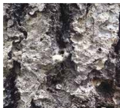
幹に2ミリの穴が見られる

5月に北山地区の村有林で、本村で初めてナラ枯れ被害が確認されました。 ナラ枯れは、カシノナガキクイムシによって病原菌が樹体に持ち込まれ、通水障害が生じ枯死に至る病気です。 今後村内で被害が拡大する可能