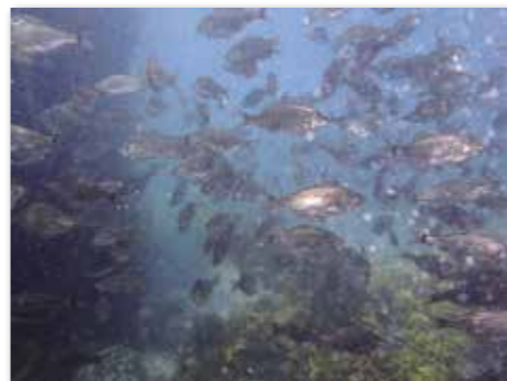
田野畑の海を泳ぐタナゴの群れ

田野畑村に移り住んで、3年目に突入しました。昨年の夏は、海況が思わしくなかったこともあり、ダイビングは盛況とはいきませんでした。天気には悩ませられましたが、楽しいこともたくさんありました。