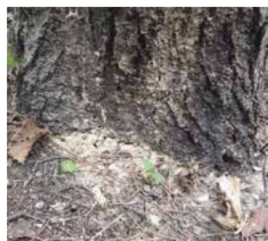
根元に木くずが堆積する