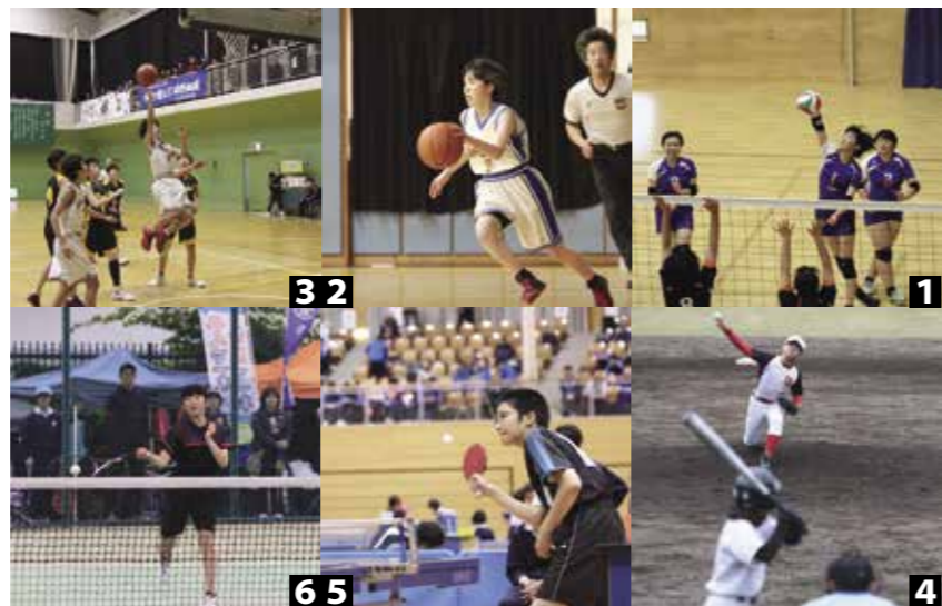
熱戦を繰り広げた1_女子バレーボール部/2_女子バスケットボール部/3_男子バスケットボール部/4_軟式野球部/5_男子卓球部/6_女子ソフトテニス部