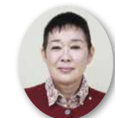
山村 明美 議員