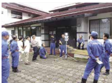
消防田野畑分署の署員から使い方の説明を受ける沼袋自主防災会のメンバー