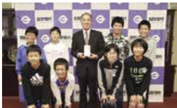
義援金を石原弘村長に手渡した児童

9月28日、田野畑小の児童が村役場を訪れ、石原弘村長に義援金を手渡しました。田野畑小では平成30年7月豪雨災害被災地の復興を願い、募金活動を行いました。義援金は日本赤十字社を通じて被災地に届けられます (佐々木 歩)