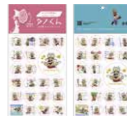
タノくんシール タノくんポストカード

◆申し込み・問い合わせ先…田野畑すまいるピラティス(☎080-6002-6262、✉smile.pilates.mari@gmail.com)