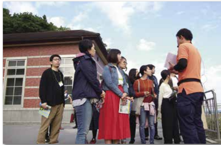
島越駅前ガイドの説明に耳を傾ける外国人留学生ら