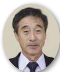
佐々木 芳利 議員

【村長】①村民の負託に応え、公約の実現を図る体制作り。形だけに捉われず、人心を大事にする。職員が村民の心に対峙し、高い理想を求めていく体制。その意味合いの中には、段階的な構造改革も含まれる。今回の承認後、10月から施行したい。