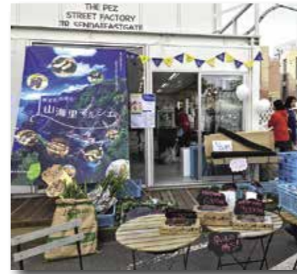
宮城県仙台市での山海里マルシェの様子

村の6産業化推進協議会が10月12日から14日に宮城県仙台市で開催した「岩手たのはた 山海里マルシェ」のお手伝いをしました。田野畑村のアンテナショップ開設の可能性を探るための、市場調査と村の特産などのPRを兼ねたフェアです。