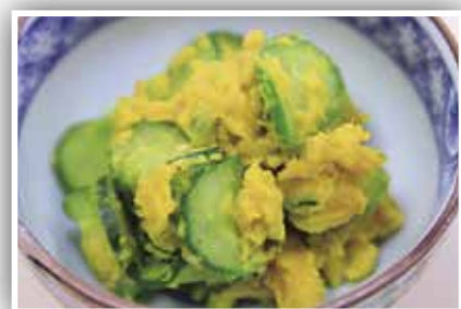
かぼちゃの簡単☆レンジdeサラダ ※エネルギー98kcal、塩分0.3g(1人分)

食生活改善推進員から一言...カボチャはビタミンEやβ-カロテンが豊富。きゅうりに含まれるビタミンCと一緒に取ることで免疫力アップの効果があります。