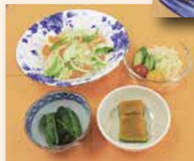
上段左から時計回りに、野菜炒め 140g、サラダ 70g、ほうれん草のおひたし 70g、カボチャの煮物 70g