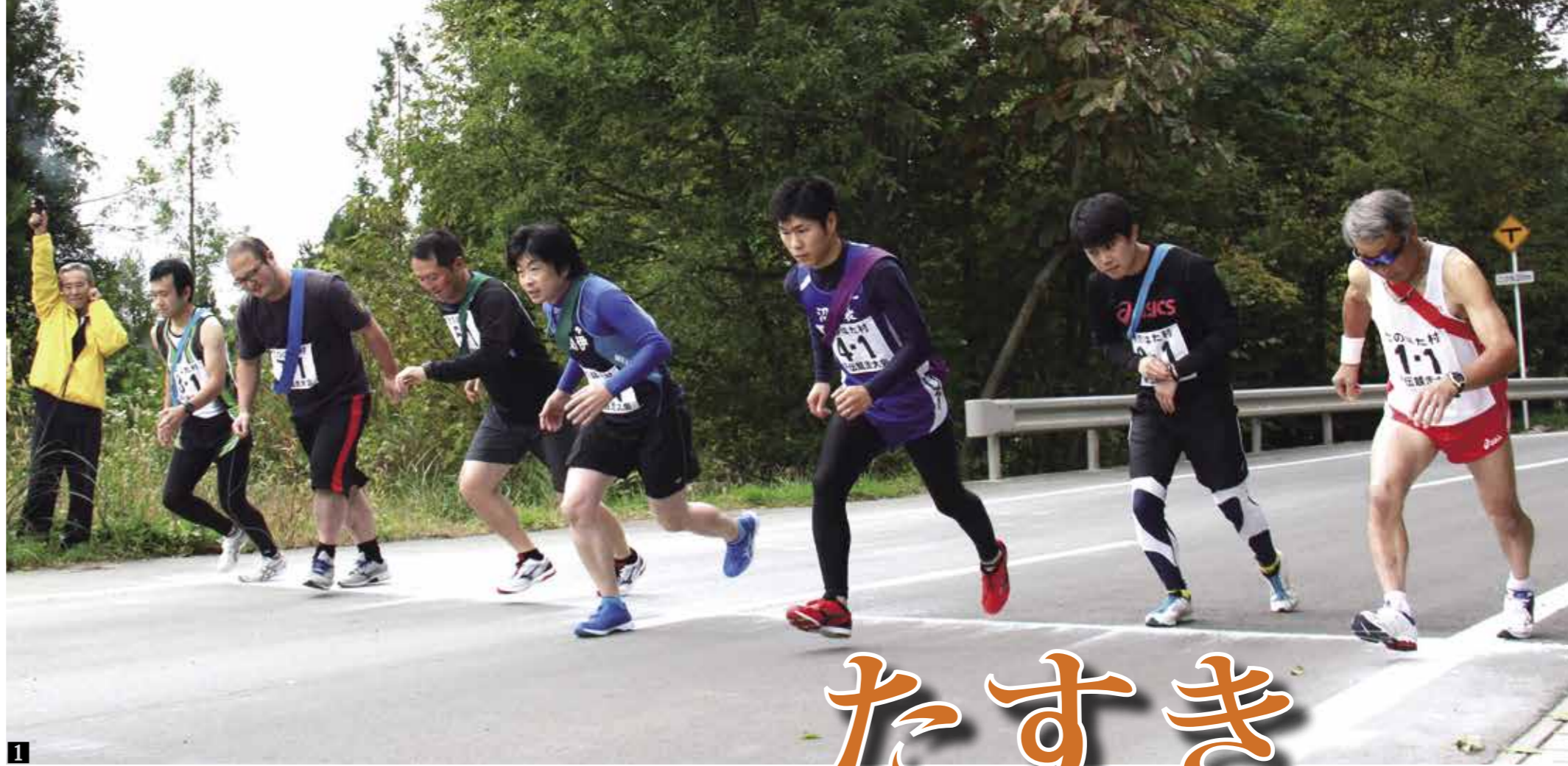
1 午前9時30分の号砲とともに、一斉にスタートする1区のランナー 2 沿道の温かい声援がランナーの背中を押す 3 4 5 チームの思いを込めてたすきをつなぐ 6 大勢の人に迎えられゴールに飛び込む