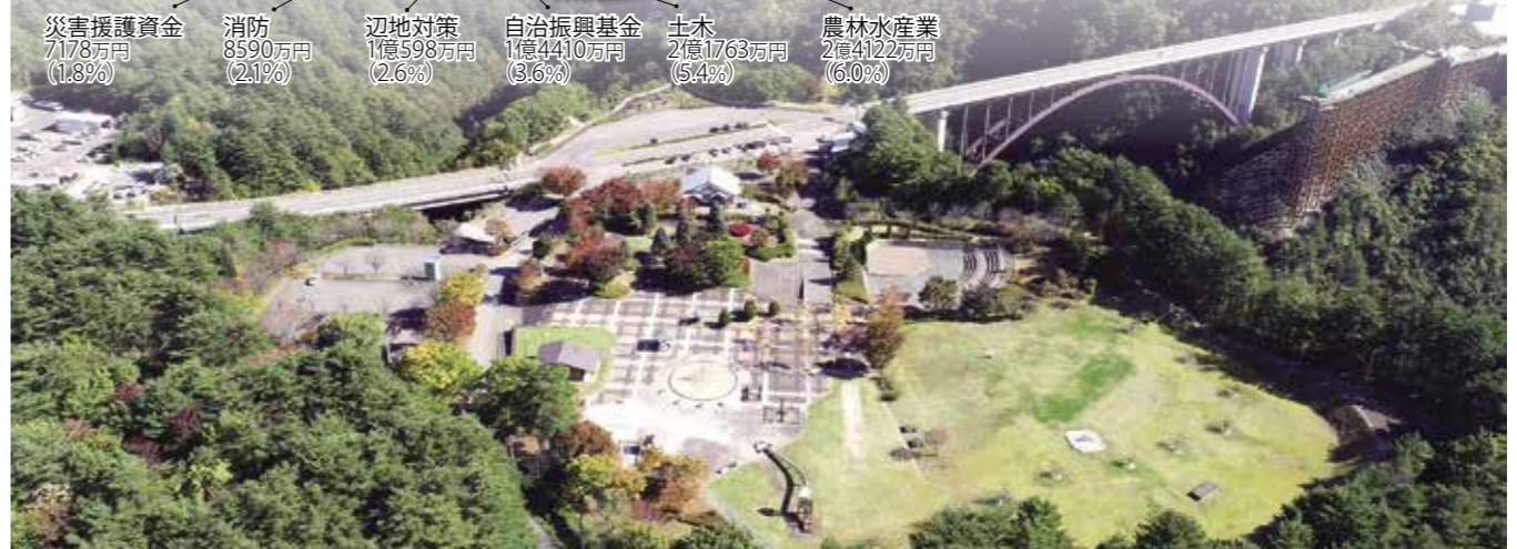
現在の道の駅たのはた周辺の様子 (10月21日・ドローン撮影)