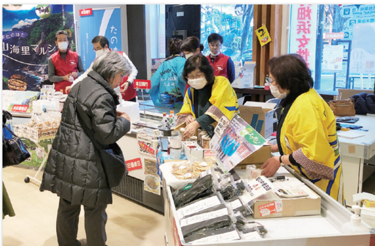
鮭の中骨水煮缶詰を売り込む村漁協浜岩泉浦女性部