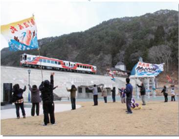
3月23日 三陸鉄道リアス線開通。久慈―盛岡が一本のレールでつながる

間もなく3月11日。東日本大震災から9年がたとぅとしていきます。皆さんにとってこの1年は、どんな年だったでしょうか？昨年3月からの1年間を広報写真で振り返ってみます。