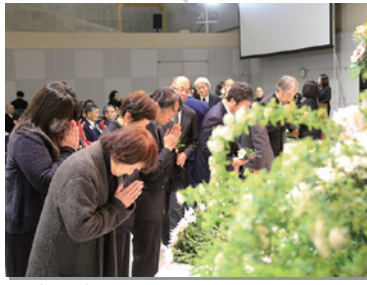
平成31年3月11日 アズビィホールで「東日本大震災追悼式」を開催。およそ200人が参列