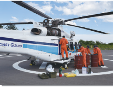
令和元年5月29日 村と海上保安庁がヘリポート使用協定を締結。全国初の取り組み