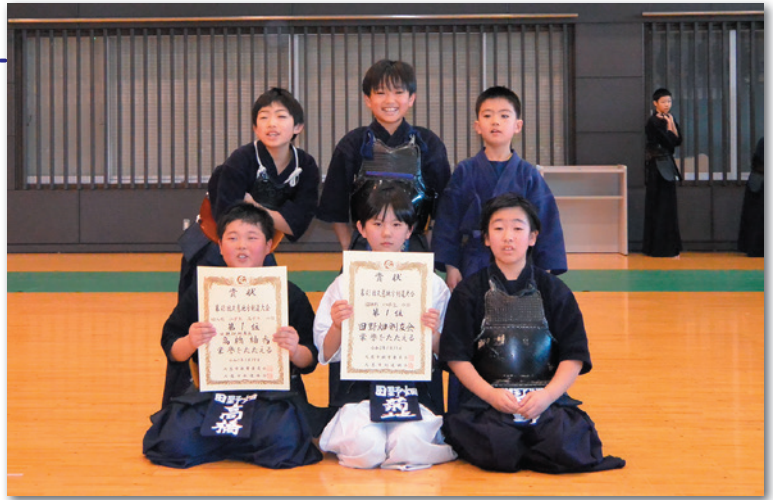
団体戦で見事優勝を果たした田野畑剣友会