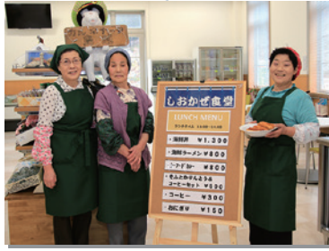
4月25日 三陸鉄道島越駅に、しおかぜ食堂オープン。地域の女性が食事を提供