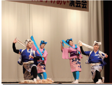
12月15日 歳末たすけあい演芸会は50回の節 目。芸能団体など14団体が出演