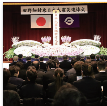
昨年の東日本大震災追悼式

時46分に防災行政無線のサイレンを鳴らします。犠牲となられた方々への黙とうに協力をお願いします