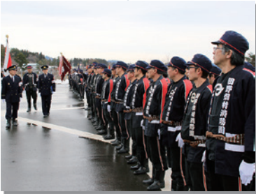
令和2年1月12日 村消防団消防出初め式。団員ら130 人が防火・防災への誓い新たに