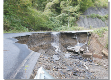
10月12、13日 台風19号による大雨の影響で、村の 沿岸部を中心に甚大な被害