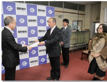
3月27日 暮らしやすい村のランドデザイン構想検討委員会で村に答申書を提出