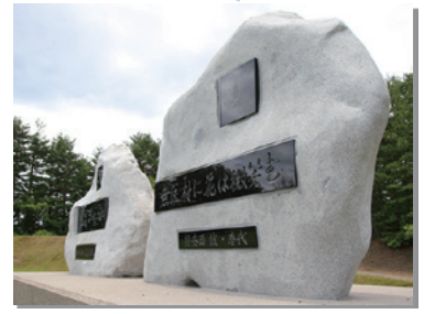
7月14日 将基面誠先生夫妻の功績をたたえる 花笑みの碑の除幕式を開催