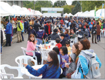
10月6日 たのはた村産業まつりを2年ぶりに 開催。村の産業団体などが出店