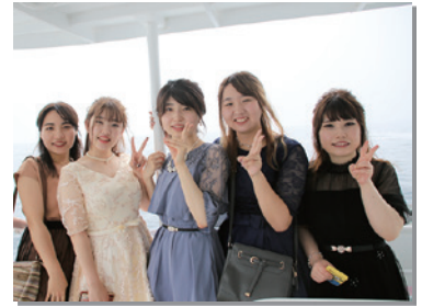
8月15日 夏の成人式。新成人30人のうち24 人が出席。大人への一歩を踏み出す