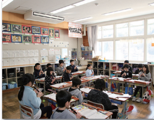
田野畑小の教室に設置したエアコン

教育委員会は、児童生徒の学習環境の充実を図るため、田野畑小の15教室に15台、田野畑中の17教室に22台のエアコンを設置しました。夏から本格的に稼働します。