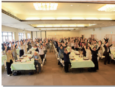
9月16日 村敬老会を開催。村内の75歳以上 100人が出席。健康長寿を祝う