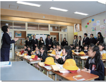
4月 小中学校入学式、児童館入園式など、新生活始まる(写真は田野畑小1年)