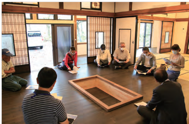
村職員から説明を受ける参加者の皆さん