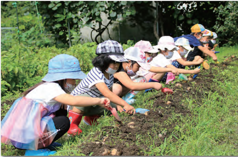
一列に並びジャガイモを掘る園児たち