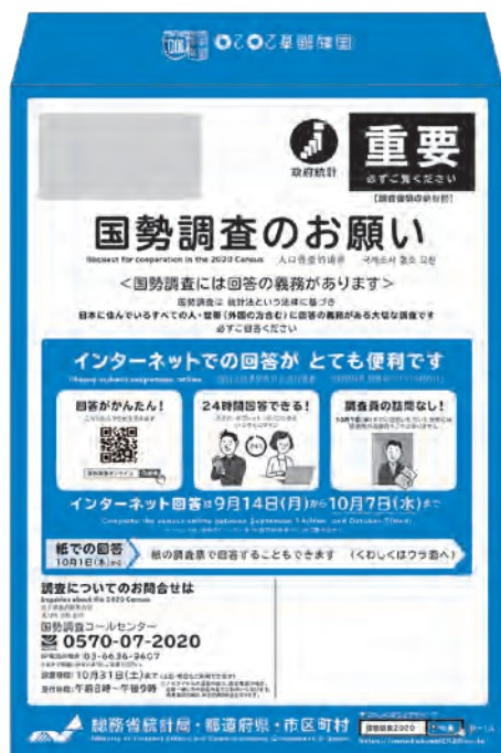
皆さんの自宅に調査票が入ったこの封筒が届きます