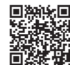
▲申し込みは ココから

第73回全国植樹祭の一般招 待者を募集します。 ◆開催日…令和5年6月4日(日) ◆場所…高田松原津波復興記念 公園 ◆募集人数…400人程度 ◆募集区分…個人または、2～ 5人以下のグループで申し込 んでください ▶個人…県内在住者で開催日時 時点で満18歳以上の人 ▶グループ…次の①～④の全て に該当 ①応募者全員が県内在住者 ②応募者全員が6歳以上 ③18歳未満の人がいる場合 は保護者の承諾がある ④代表者は18歳以上 ◆申し込み方法…専用サイトま たは郵送で申し込んでくださ い。詳しくは、全国植樹祭ホ ムページを確認するか問い合 わせてください ◆申込期限…12月23日(金) ◆その他…重複での申し込みは 無効とする場合があります ◆問い合わせ先…全国植樹祭推 進室(☎019-629-5810)