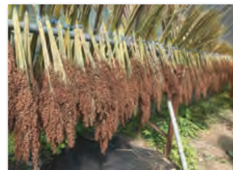
刈り取ったタカキビを干している様子

モチキビからスタートした今年の収穫。モチアワ、ウルチアワは穂刈りをしてネットに詰め込みました。私の身長をはるかに超えたエゴマとタカキビも穂を刈って干しました。ヒエは刈ったあとにヒエ島を作って乾燥させました。