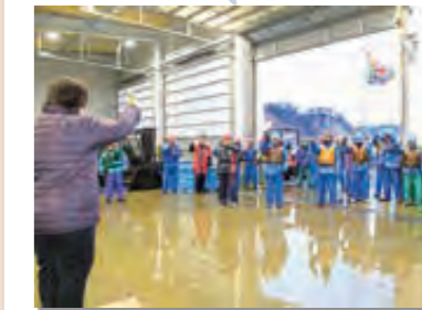
1月4日 村漁協の初売り。タラやサケなどが水揚げされ、市場が活気にあふれる