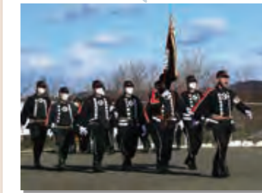
1月10日 村消防団出初め式。団員や女性消防協力隊員が地域防災への誓い新たに