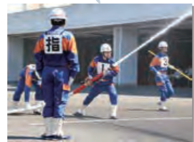
6月26日 宮古地区支部消防操法競技会で村消防団第4分団が県大会出場を決める