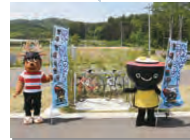
5月26日 道の駅たのはたがいわてサイクルステーション第1号に登録