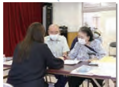
8月～9月 各地区公民館を巡回し、マイナンバーカードの申請サポートを実施