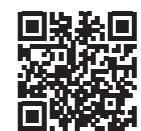
▲全国植樹祭 ホームページ