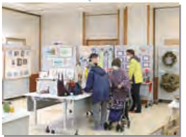
11月3～6日 第49回村民文化展を開催。431点の芸術作品が来場者の目を楽しませた