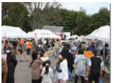
10月8～10日 たのはた産業祭を開催。約8,000人が会場を訪れにぎわいを見せる

間もなく2023年。今年も残すところ1カ月となりました。皆さんにとってこの1年は、どんな年だったでしょうか？今年1年間を広報写真で振り返ってみます。