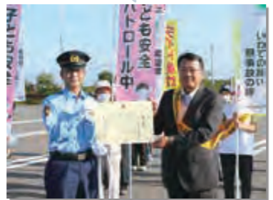
9月15日 交通死亡事故ゼロ8年を達成。県警本部長から称賛状を受ける