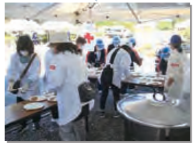
9月25日 村総合防災訓練を開催。訓練を通して災害時の備えと行動を確認