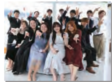
8月15日 20歳の集い式と21歳、22歳の集い式を開催(写真は20歳の皆さん)