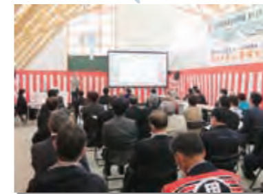
4月22日 道の駅たのはたがリニューアルオープンから1周年を迎える