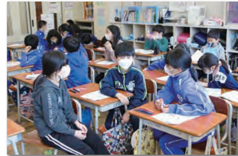
認知症の人への接し方を考える児童たち