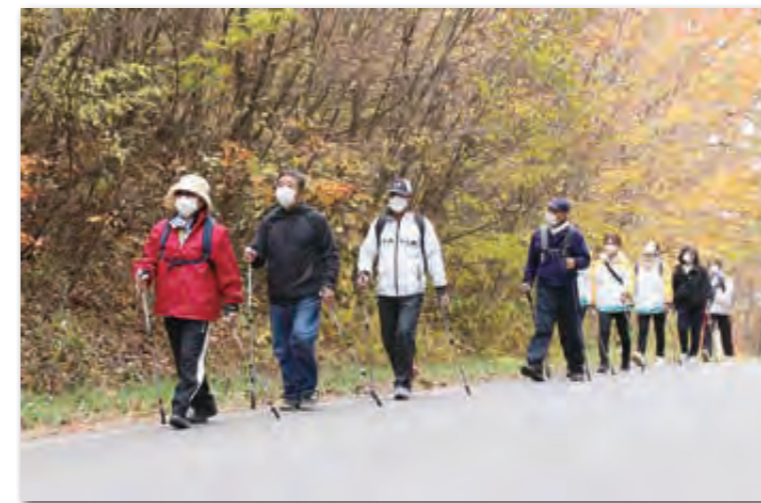
ノルディックウォーキングを楽しむ参加者の皆さん