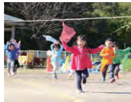
笑顔が光る若桐保育園の園児。子育て世帯の生活を支援します