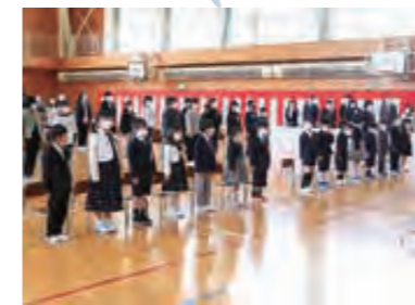
4月 小中学校入学式。新生活が始まる(写真は田野畑小)