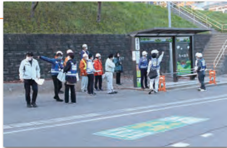
危険箇所がないか点検する関係者の皆さん

点検箇所は、▶田野畑小▶浜岩泉▶大芦▶羅賀のバス停4カ所とその周辺の通学路。参加者からは「横断歩道の塗り直し」や「道路標識・バス停の劣化」などの意見が出されました。