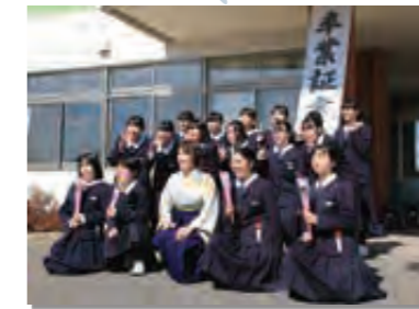
3月 小中学校卒業式、保育園、児童館卒園式。巣立ちの春(写真は田野畑中)