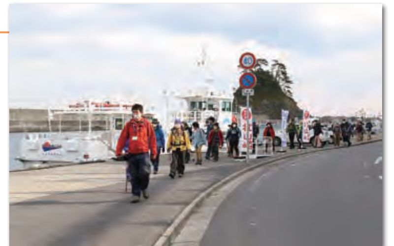
海沿いのコースを歩く参加者の皆さん

参加者は、紅葉で色づく山道や潮風を感じる海沿いのコースを歩きながら、村の自然を楽しんでいました。