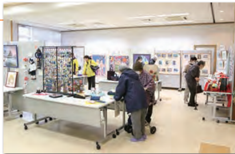
会場に飾られた芸術作品が来場者の目を楽しませた

49回目の今年は、田野畑小の児童や田野畑中の生徒、絵画クラブ、村社会福祉協議会、介護施設、教育委員会で開催した趣味・教養講座の参加者など、個人・団体が431点を出展。絵画や工芸、手芸、書道などの個性豊かな芸術作品が来場者の目を楽しませていました。