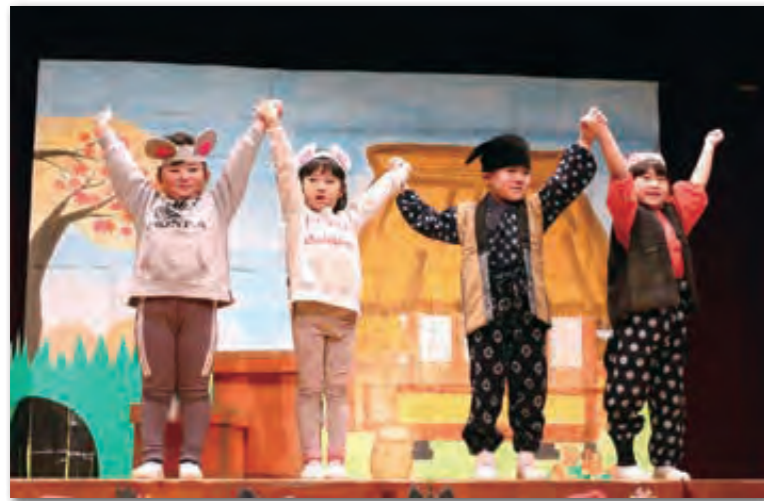
おむすびころりんを発表した年長組の園児たち