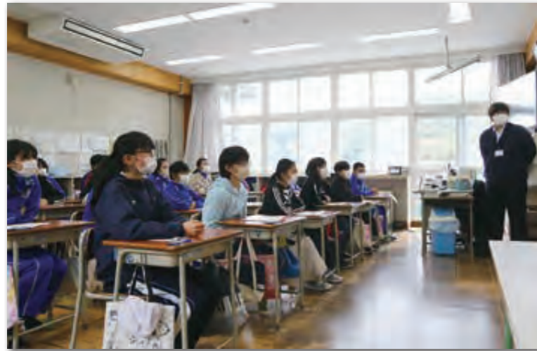
税金の大切さを学ぶ児童たち