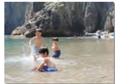
7月 机浜海水浴場を開設。村内外から約400人が訪れ海水浴を楽しんだ