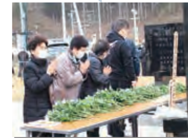
3月11日 島越地区の東日本大震災追悼式。参列者が犠牲者の安らかな眠りを祈る