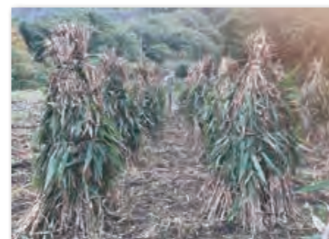
ヒエはヒエ島を作り乾燥

モチキビからスタートした今年の収穫。モチアワ、ウルチアワは穂刈りをしてネットに詰め込みました。私の身長をはるかに超えたエゴマとタカキビも穂を刈って干しました。ヒエは刈ったあとにヒエ島を作って乾燥させました。