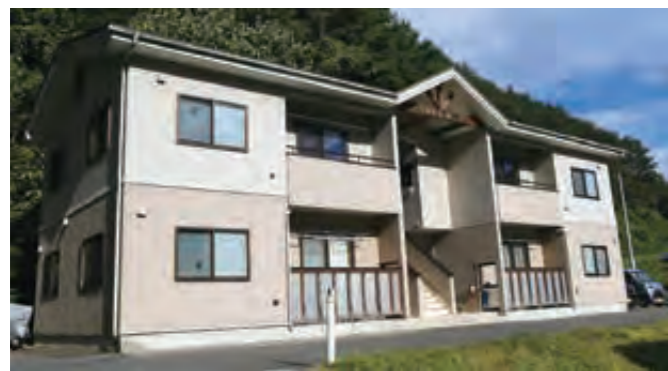
入居者を募集する羅賀団地C号