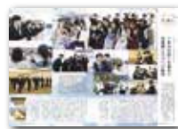
3位に入選した9月1日号