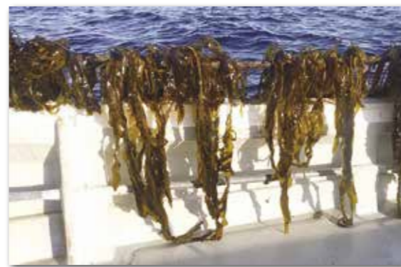
1月頃の養殖ワカメ

稲には、コシヒカリやササニシキなどの品種があります。実は、ワカメにも品種があります。田野畑村のワカメは「ナンブワカメ」という品種です。この品種は宮城県の牡鹿半島から岩手県の久慈市に分布しています。