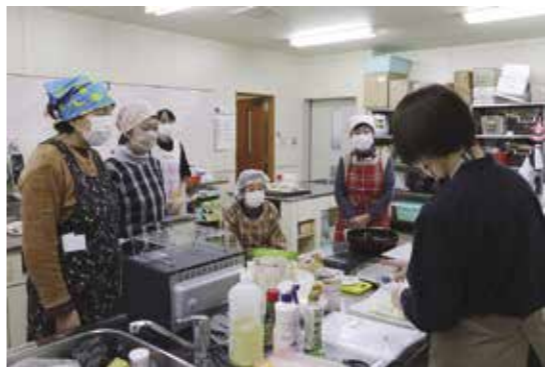
昨年12月に開催された食育講座の様子