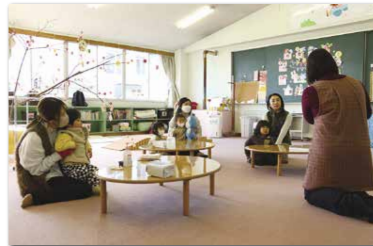
親子で絵本の読み聞かせや手遊びなどを楽しんだ