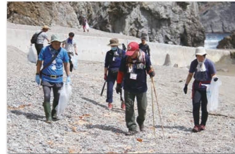
トレイルを歩きながら海岸のごみを拾う参加者たち