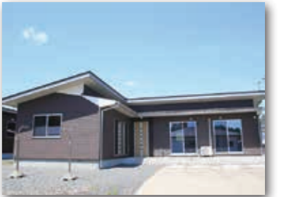
黎明台団地22号棟 災害公営住宅