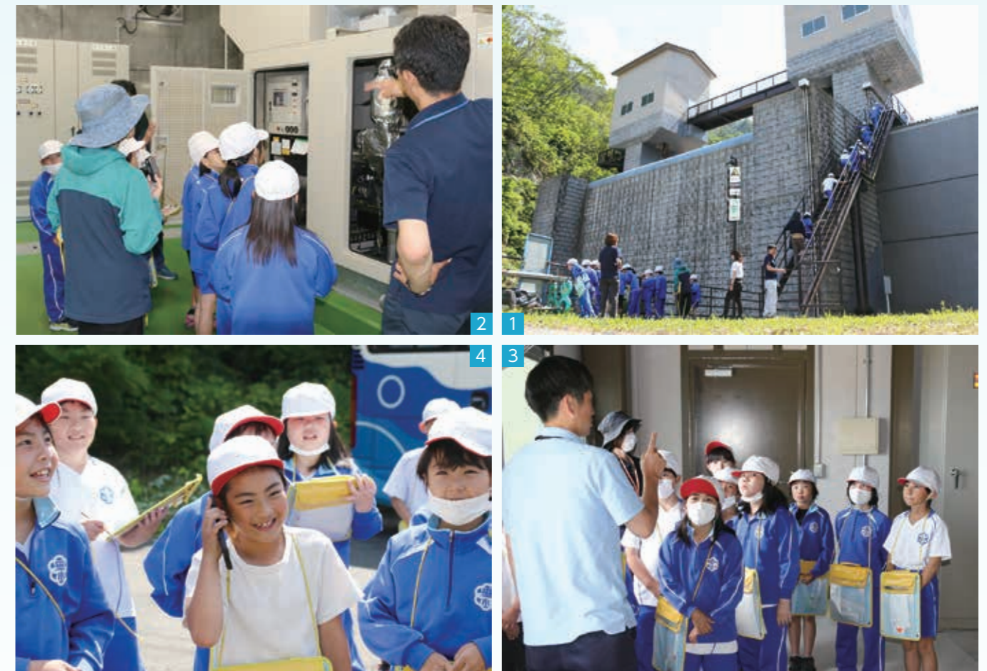
1_「水門はどんな作りになっているんだろう」と興味津々の児童たち。陸閘が閉まったらこの階段を使って避難／2_機械室の役割を教わる／3_高所にある操作室で設備の仕組みと水門の操作方法を学ぶ／4_消防田野畑分署に遠隔操作による水門閉鎖を依頼

水門は、津波から僕たちの命を守る大事な施設だということが分かりました。実際に水門が閉まる場所を見て、思っていたよりもゆっくり閉まることに驚きました。