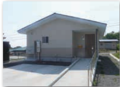
菅窪団地11号棟 村営住宅