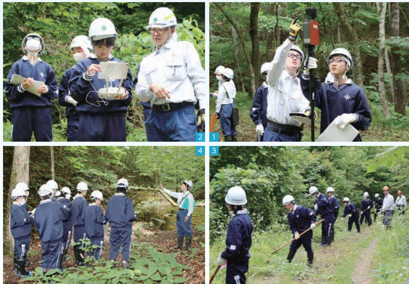
1_最新の計測装置OWLの操作や機能などを教わる。OWLは、レーザーにより周囲の木の木数や太さ、高さなどの計測が簡単にできる／2_ドローンを操作して上空から山林の様子を観察／3_鎌を使って環境整備／4_治山ダムの役割などを学ぶ