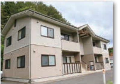
羅賀住宅D号 定住促進住宅