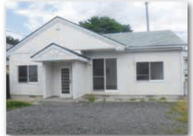
田野畑団地1-1号棟 村営住宅