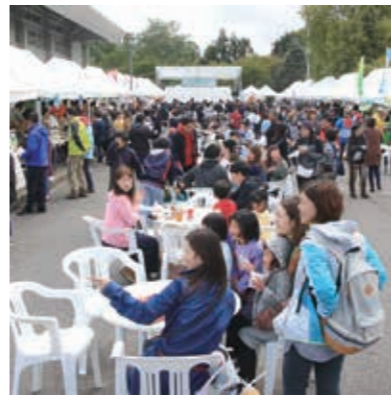
令和元年の産業まつりの様子