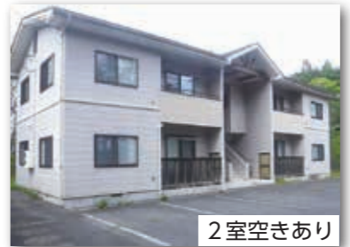
大芦住宅C号・D号 定住促進住宅