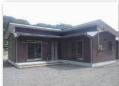
松前沢団地6号棟 災害公営住宅