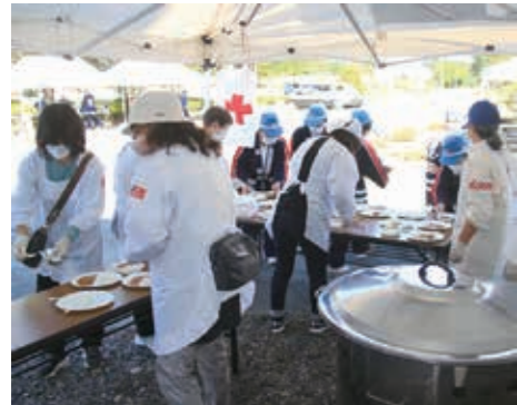
昨年の村総合防災訓練の様子