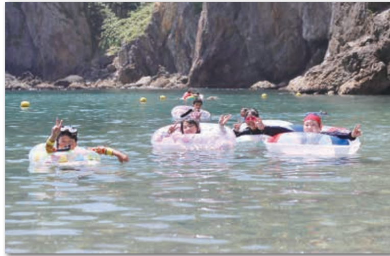
元気いっぱい遊ぶ子どもたち