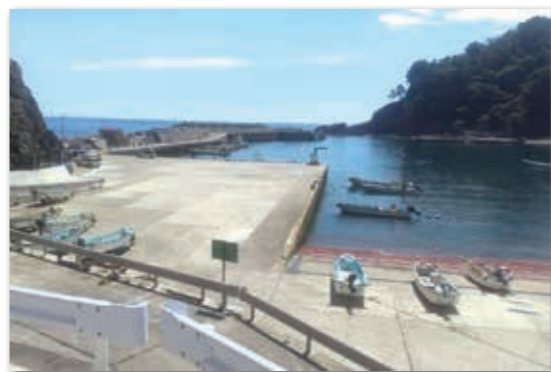
共同利用施設の平井賀漁港

皆さんは「ポツンと一軒家」というテレビ番組をご存じですか。この番組は集落から離れた場所で生活する人を紹介し、そのほとんどが農林畜産業従事者です。一方、水産業関係者の紹介は非常に少なく、特に海面養殖漁業従事者は見たことがあり