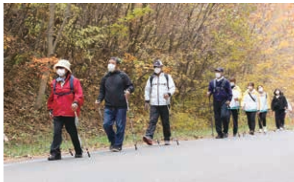
昨年開催されたノルディックウォーキング教室の様子