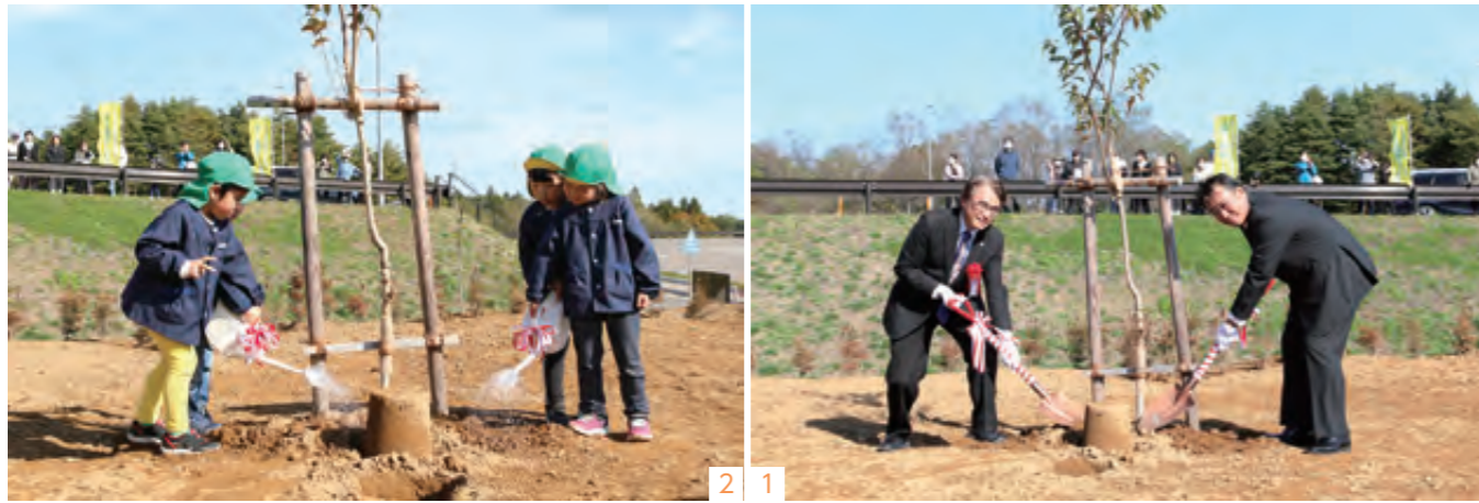
2 1 4 3