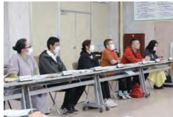
意見を出し合う委員の皆さん