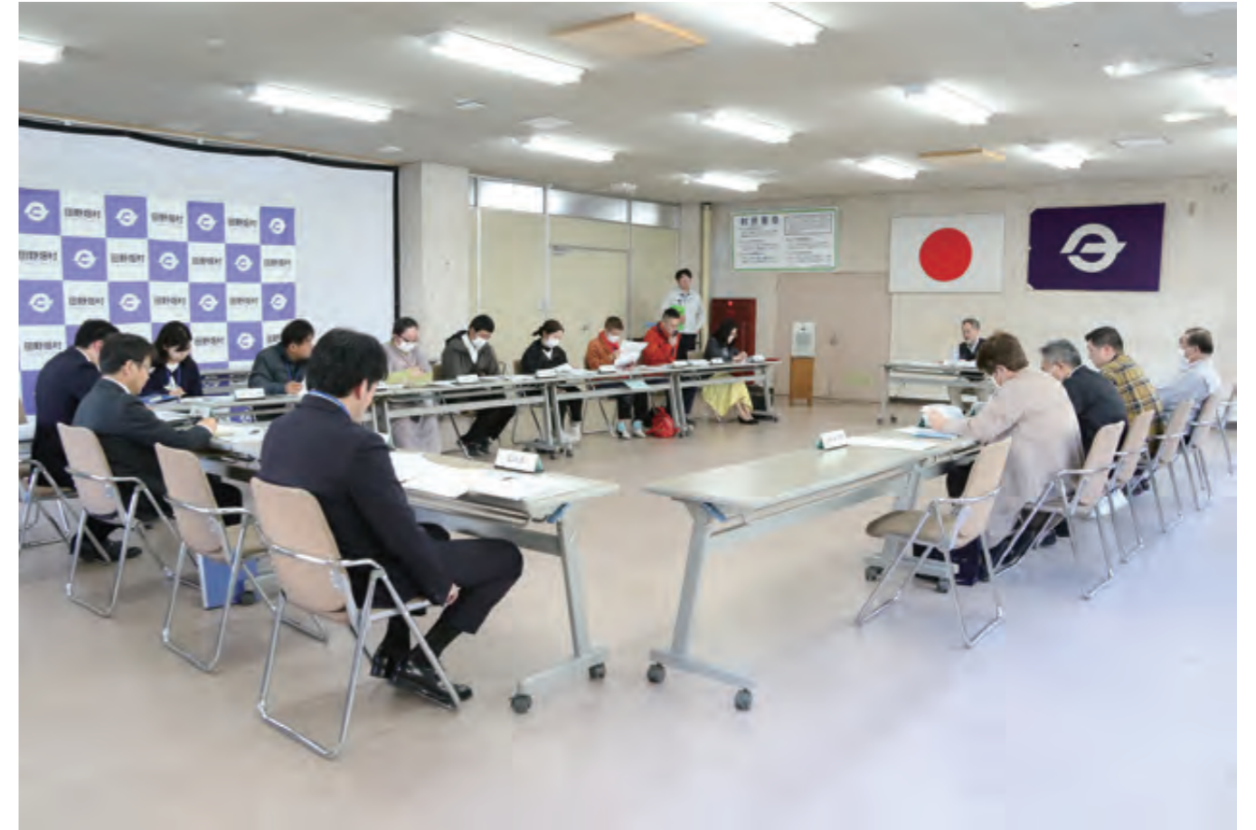
第1回村新庁舎建設検討委員会の様子。新庁舎建設に向けて議論が再開された