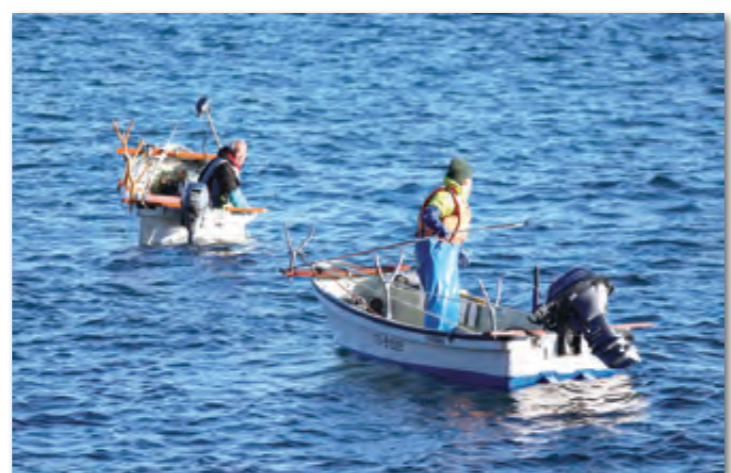
アワビ漁を行う漁業者のサッパ船

村役場(代表) ☎34-2111 / 税務会計課 ☎34-2112 / 地域整備課 ☎34-2113 / 住民生活課 ☎34-2114 教育委員会 ☎34-2226 / 内科診療所 ☎33-3101 / 歯科診療所 ☎33-3100 / 保健センター ☎33-3102 ※健診結果説明会の日程は22㉮を確認してください