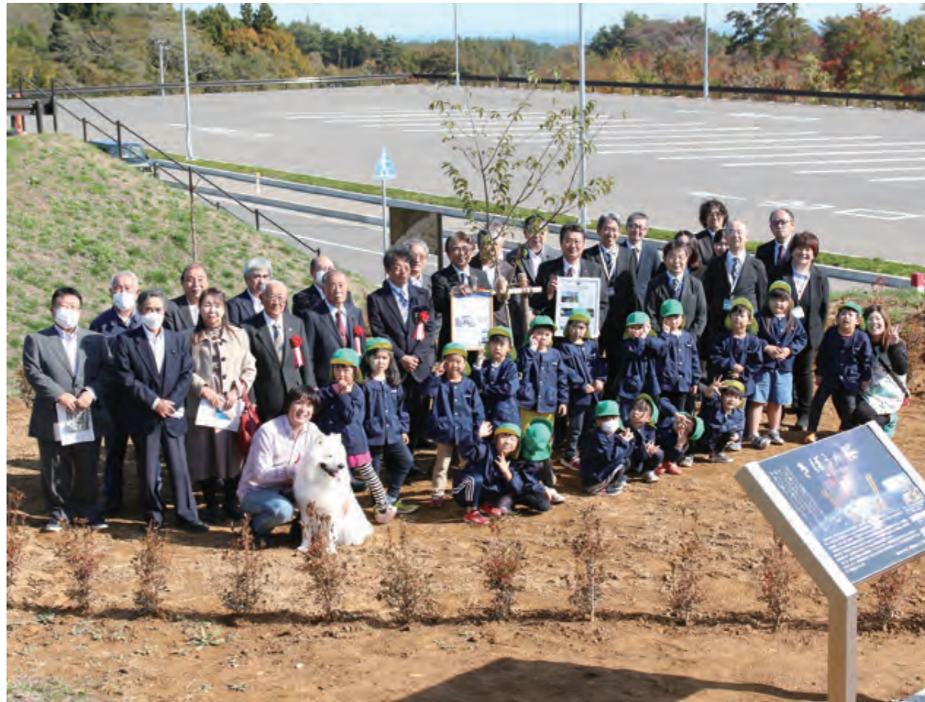
宇宙を旅したきぼうの桜を囲み、笑顔を見せる出席者ら きぼうの桜の周りには10月28日、いわての森づくり県民税を活用してドウダンツツジ150本を植樹した

高知県仁淀川町から贈られた宇宙を旅したひょうたん桜 お披露目されたきぼうの桜は、一般財団法人ワンアースの協力により、高知県仁淀川町から寄贈されたもの。平成20年、仁淀川町の児童が採取したひょうたん桜の種約200粒が同年11月15日、NASAスペースシャトル・エンデバー号に乗って宇宙へ出発しました。その後この種は、国際宇宙ステーション内にある日本の実験棟「きぼう」に移され、地球を約4100周し、平成21年7月31日、若田光一宇宙飛行士とともに地上に帰還しました。 帰還した200粒のうち無事に発芽し、宇宙桜として育ったのはわずか4粒。この4粒の宇宙桜から接ぎ木によって増殖した苗木が、きぼうの桜として田野畑村の地に根を張りました。 宇宙を旅したアカマツも植樹 東北復興宇宙ミッション2021(一般財団法人ワンアース主催)で宇宙を旅した本村のアカマツ。岩泉林務出張所(佐々木康彦所長)によって大切に育てられ、きぼうの桜とともに道の駅たのはた敷地内に植樹されました。