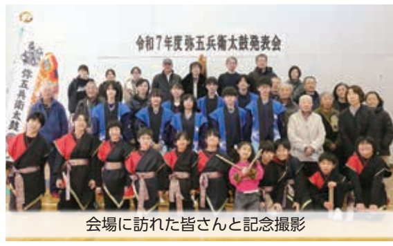
会場に訪れた皆さんと記念撮影