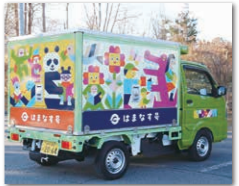
各地区を巡回する「はまなす号」