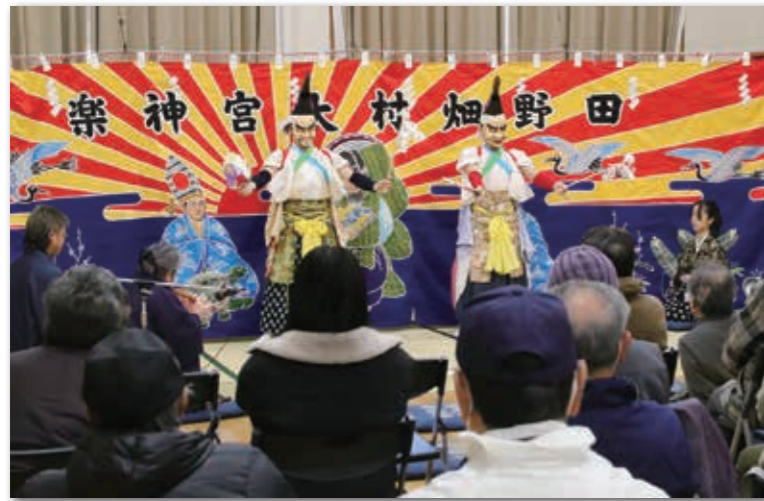
新年最初の演目「岩戸開き」を披露