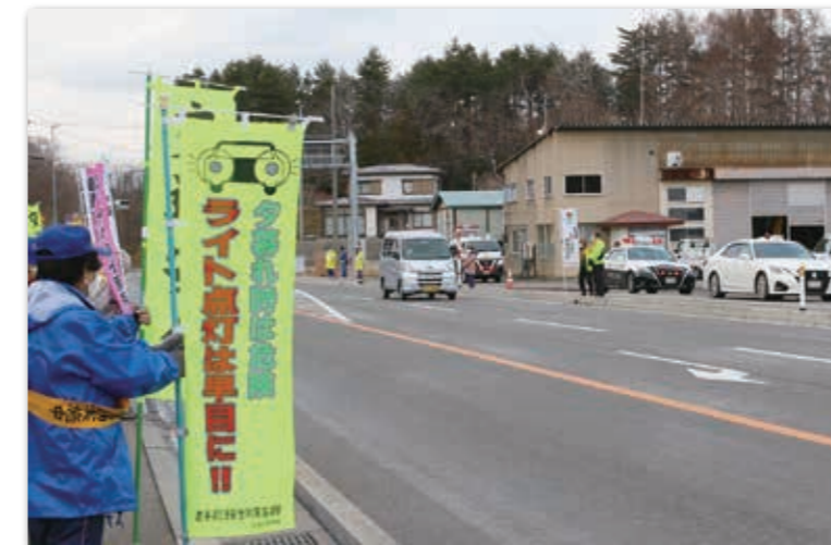
のぼり旗を掲げ安全運転を呼び掛ける参加者