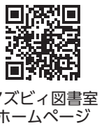
アズビィ図書室ホームページ