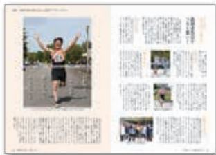
広報紙の部で3位に入選した11月1日号