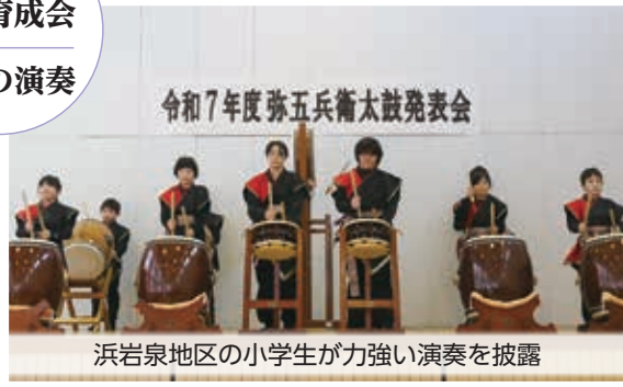
浜岩泉地区の小学生が力強い演奏を披露