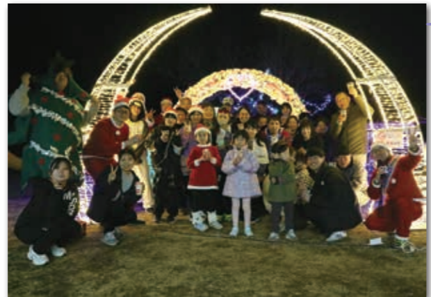
イルミネーションを楽しむ参加者

村役場(代表) ☎34-2111 / 税務会計課 ☎34-2112 / 地域整備課 ☎34-2113 / 住民生活課 ☎34-2114 教育委員会 ☎34-2226 / 医科診療所 ☎33-3101 / 歯科診療所 ☎33-3100 / 保健センター ☎33-3102