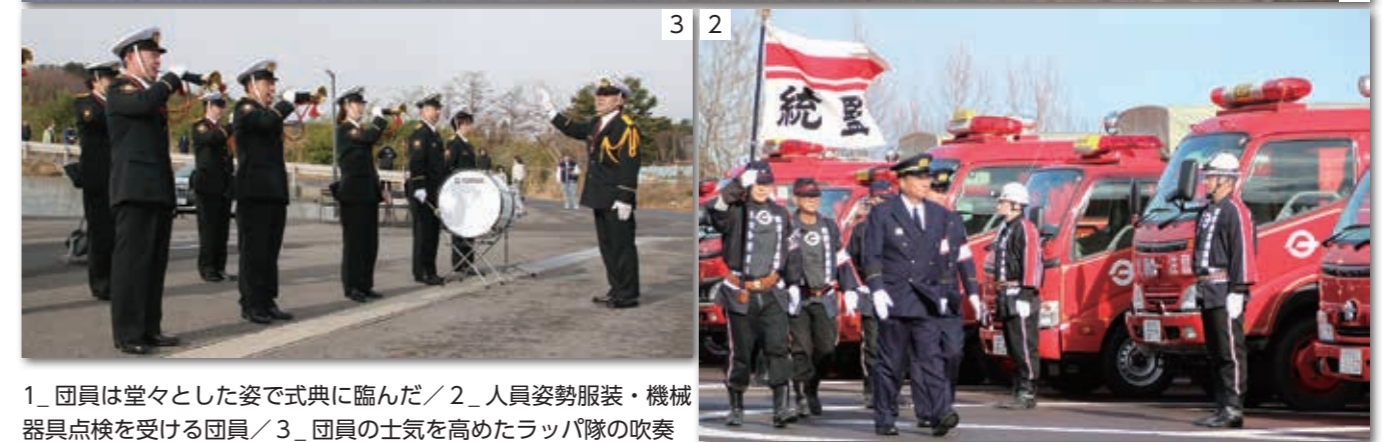
1_団員は堂々とした姿で式典に臨んだ／2_人員姿勢服装・機械器具点検を受ける団員／3_団員の士気を高めたラッパ隊の吹奏