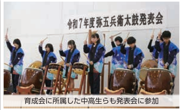
育成会に所属した中高生らも発表会に参加