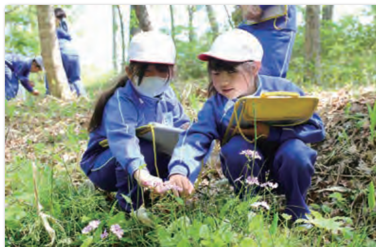
しゃがみ込んでサクラソウを観察する児童