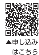
▲申し込みはこちら