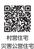
村営住宅 災害公営住宅