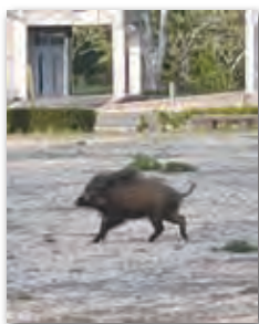
目撃したイノシシ

▼6月号の取材に協力していただいた皆さん、ありがとうございました。6月号の編集をしていると、隣の小学校から子どもたちの大きな声と太鼓の音が聞こえてきます。5月30日に行われる運動会に向けて、練習にも熱が入っているようです。取材に協力してくれた2人のキャプテンをはじめ、運動会での児童の様子は本紙7月号でお届けします。▼5月の大型連休中のこと。アズビイ施設の前を車で通りかかると、そこには2頭のイノシシが。こんなところにも出没するのかと驚きました。近年は、クマやイノシシの目撃情報が多く寄せられています。やぶの刈り払いや未利用果樹の伐採、ごみの管理など、今一度身の周りの環境を見直してみましよう。そして、自分自身や大切な人を野生鳥獣による被害から守るため、それぞれができる対策を行っていきましょう。 （企画観光課 熊谷 航大）